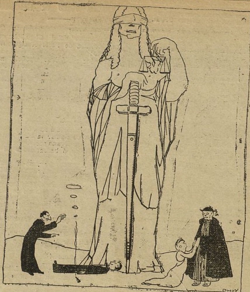
La Garra de Linares Rivas, reestrenada con gran éxito por la compañía de Eslava.

Nos figuramos a la «mise en scene» con un lápiz en lo alto de una escale-