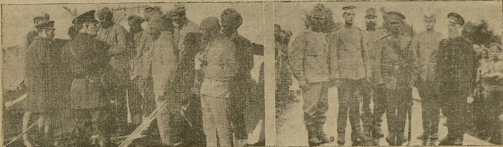
ALEMANIA EN LA GUERRA. Prisioneros austriacos y alemanes