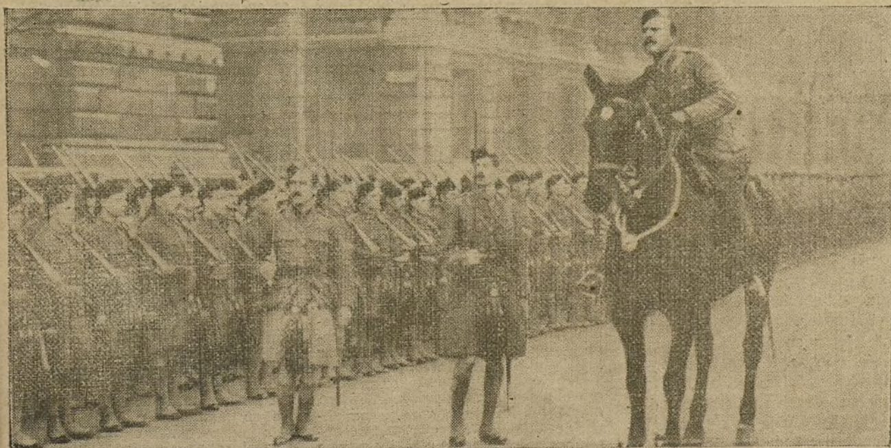
INGLATERRA EN LA GUERRA. Regimiento de escoceses formado exclusivamente por voluntarios de Londres.

La propaganda germanófila en España es la única manera de atraer la liquidación nacional. "Se elige cuando se ha fortificado el albedrío", dice Maura. ¿Cómo es posible que podamos orientarnos, en uno o en otro sentido, si las circunstancias nos obligan a estar en inteligencia con nuestros vecinos de una manera forzada? En una frase; como muchas veces lo ha hecho, Maura ha concretado gráficamente el problema internacional español. Debemos estar al lado de los que pueden perjudicarnos, no por amor a ellos, si no lo sentimos, por conveniencia. En la visión clara y serena de los hechos y del porvenir se diferencian un estadista como el jefe del partido conservador, y un lírico como el jefe de los tradicionalistas. En la cer-