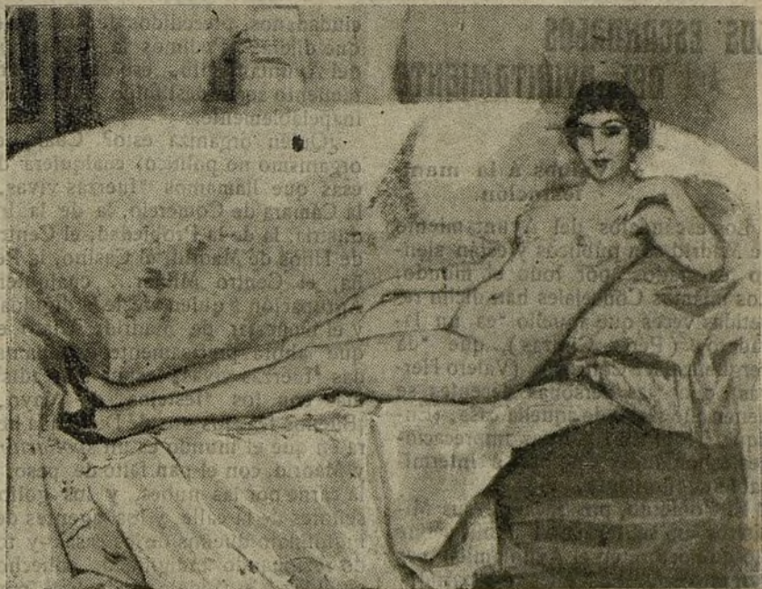
Retrato de Mirabella. — Cuadro de Beltrán.