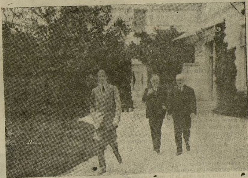
El Rey acompañado del Conde de Maceda, saliendo del estudio de Moreno Carbonero.

defecto, la insuficiencia del lector que carece de energía para mantener la atención, cuando no de cultura para enterarse bien de lo que se le expone.