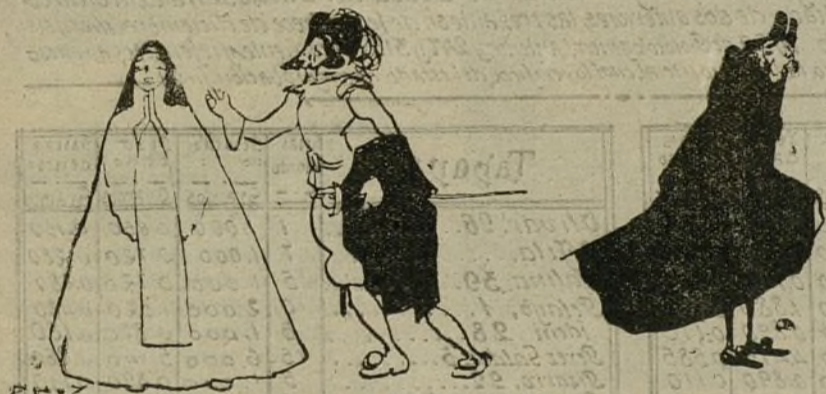
Personajes de Margarita la Tornera.