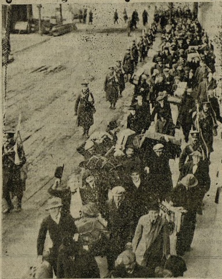
Alemania en la guerra.—Conducción de prisioneros alemanes por una de las calles de Londres.

Los austro-alemanes siguieron el plan de operar dos grandes divisiones estratégicas para engañar á los rusos. Debe advertirse ya que en Oriente las diversiones estratégicas ideadas por los alemanes tienen muchas probabilidades de éxito, porque disponen de una red ferroviaria muy densa, muy estratégicamente distribuida, y efecto de ello pueden mover perfectamente sus tropas, consiguiendo superioridad numérica en el punto apeteído. Esta es la máxima fundamental de toda estrategia, el secreto de todas las victorias napoleónicas: arreglarse de modo que, teniendo menos tropas que el adversario, en un punto determinado y decisivo se disponga de más. Es inquestionable la superioridad numérica de los rusos; pero como disponen de