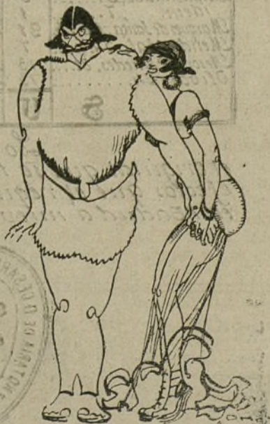
Salomé y el Bautista.