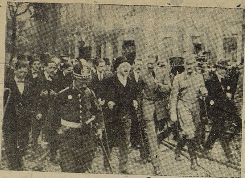
El incendio de las Salesas.—El Rey recorriendo los alrededores del palacio de Justicia. (Fotografía tomada momentos antes de que S. M. hablase con el señor Alcalde.)