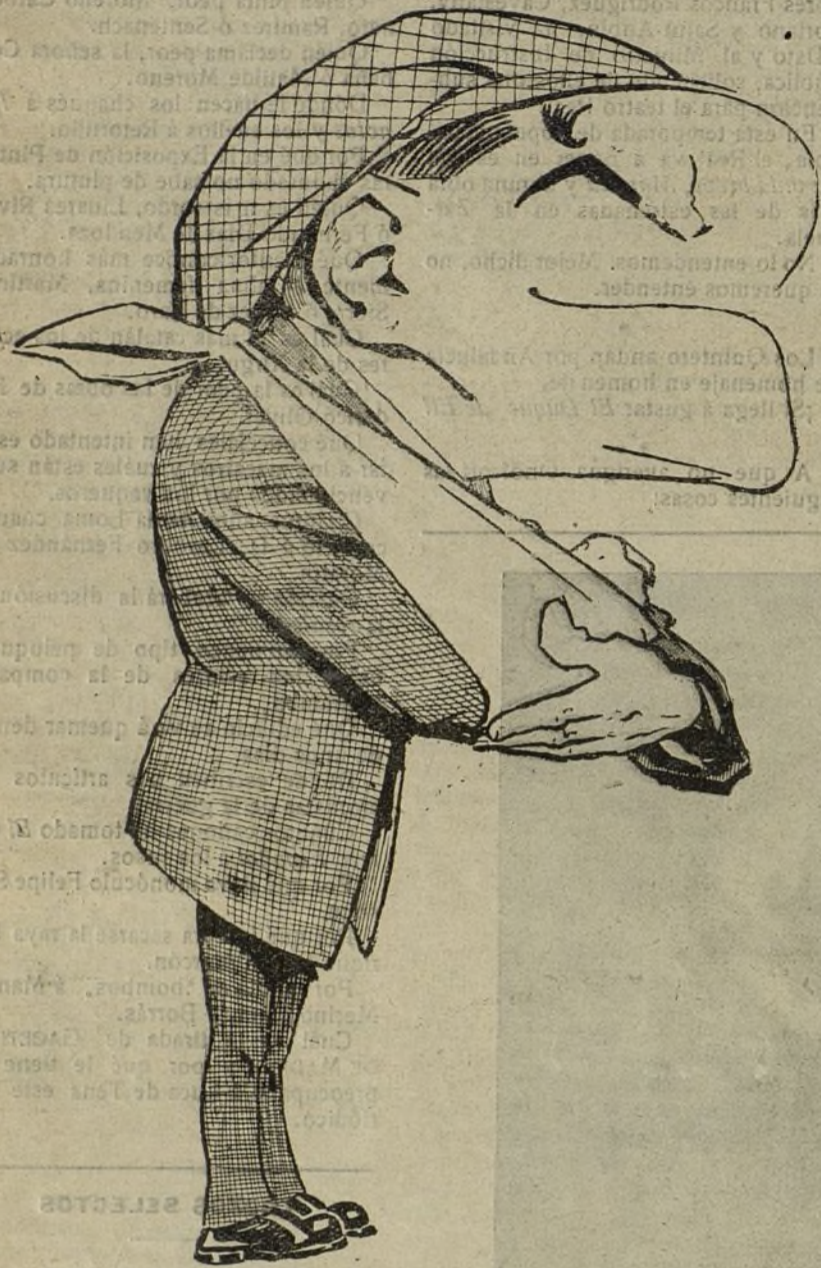
La bonita suerte del cabestrillo ó una raja en la piel y una rajadura en la fecha (Caricatura que fué de actualidad.)

La competencia de hoy.—Joselito y Belmonte, mano á mano.