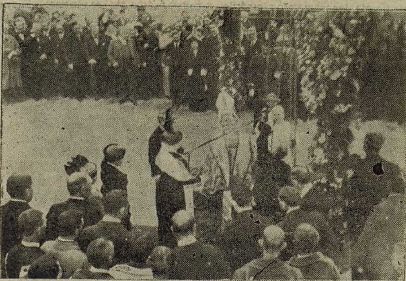
S. M. la Reina Victoria en la colocación de la primera piedra del sanatorio para tuberculosos en Valdelata.

El escribiente.—(¡Es un flo que sabe más que Cajal!)