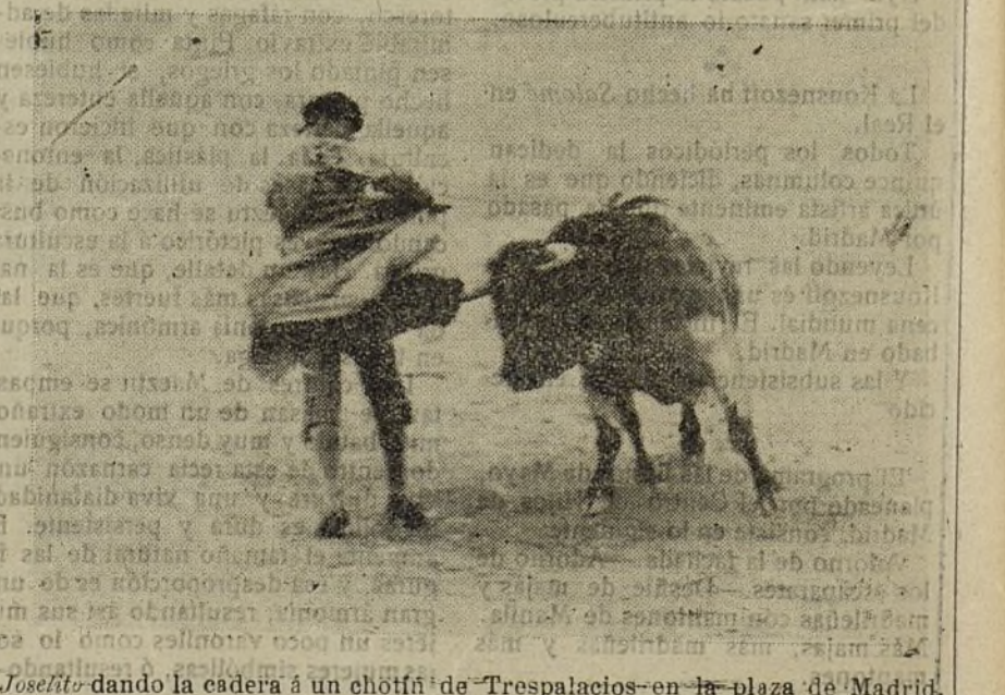
Joselito dando la cadera á un chotín de Trespalacios en la plaza de Madrid.

¡Bueno! ¡Y los aficionados á la grena! ¡Y los revendedores haciendo su agosto!! ¿Seremos primos ???