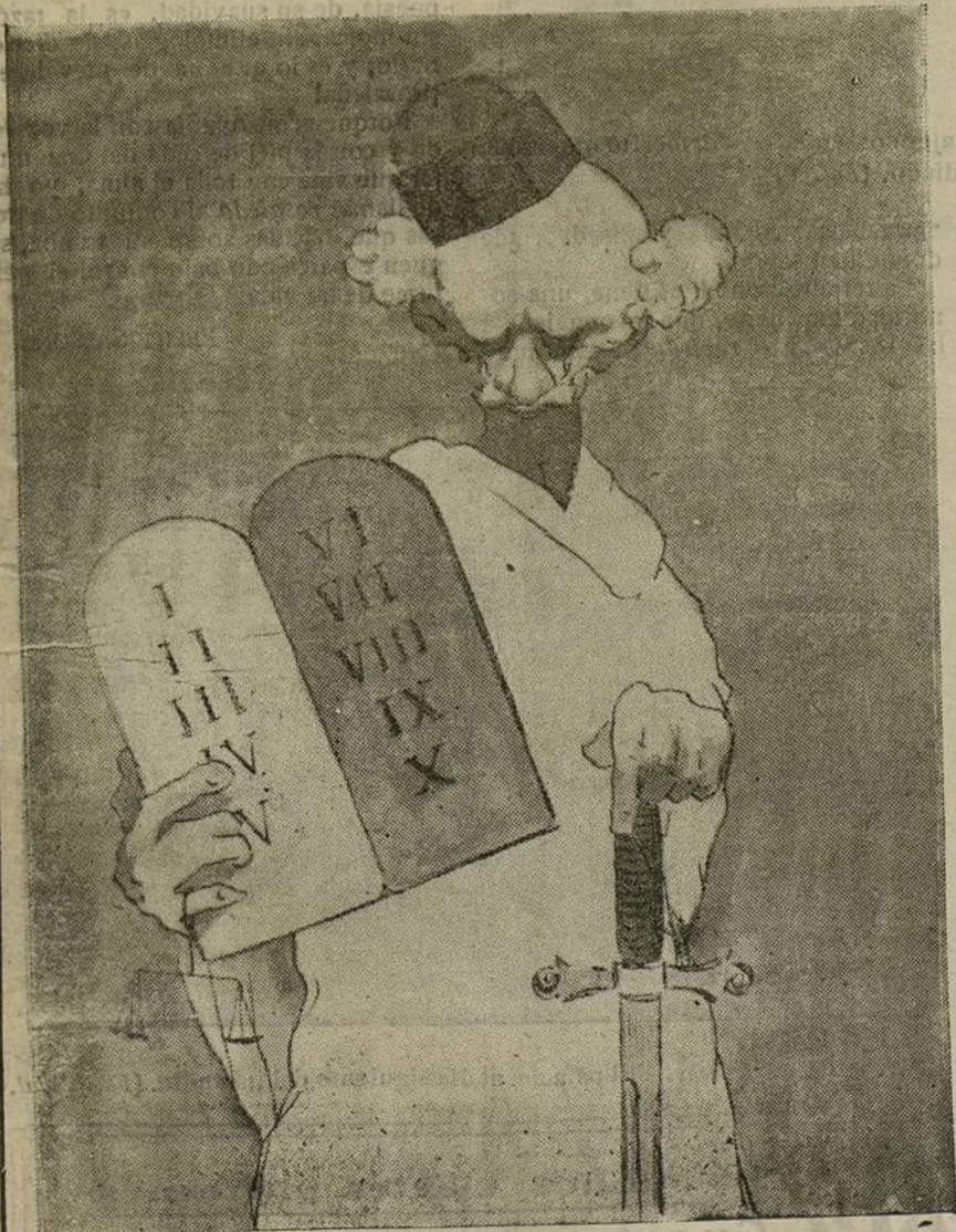
Dice la Biblia: Y Moisés bajó del Sinaí y mostró al pueblo las tablas de la Ley. Los israelitas, como tardaba Moisés, estaban muy aburridos. (Caric. de D'Hoy.)