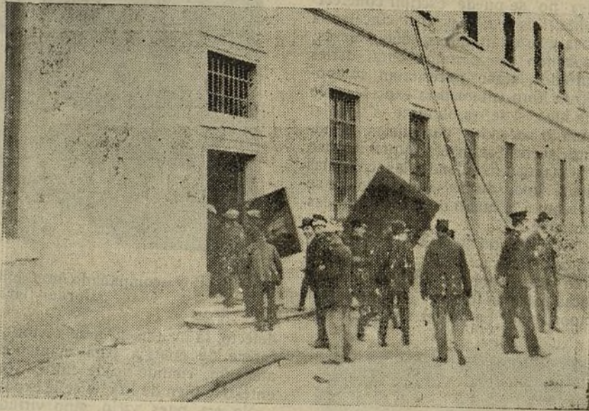
El fuego de las Salesas.—Salvamento de algunos cuadros de mérito que había en el edificio incendiado.

Ellos son los que, siempre al servicio de la clientela, defienden á las Compañías y á las Empresas que obstruyen la vida del país, que lo dominan, que lo explotan y