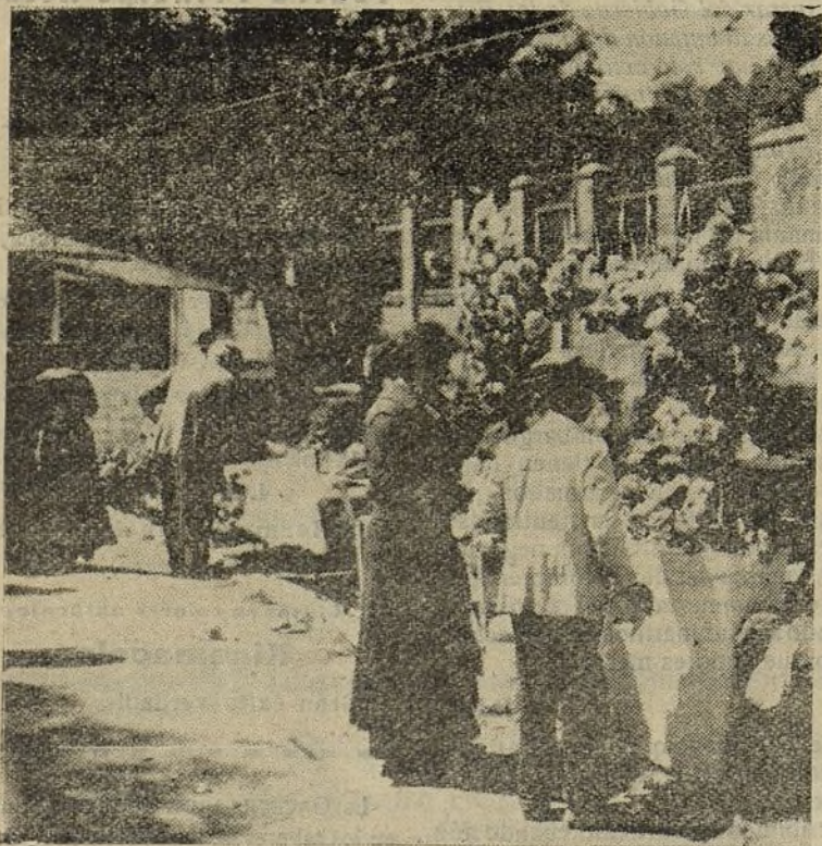
En la romería de San Isidro. — Comprando pitos.

Acaso adviertan los críticos que esos versos son los de siempre. ¿Y no vale más que sean los de siempre que no los de nunca?