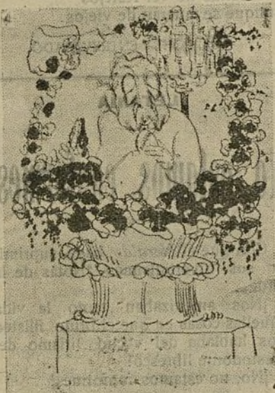
Otro número del programa de festejos.—Presentación del señor Alcalde en una preciosa canastilla á toda luz.

A esto le decimos negocio en el peor sentido de la palabra. Queremos decir que en este asunto no se ventila ni se discute el interés del vecindario; se discute el interés privado, los negocios y el dinero de unos cuantos