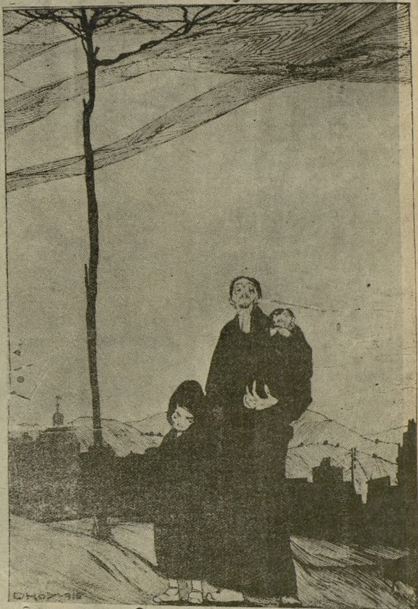
El último número de las fiestas de Madrid.—Apoteosis del hambre española, madrileña y provinciana. (Dibujo de D'hoj.)

Si la minoría republicana no acude al Ayuntamiento, ¿no podría acaecer que se hicieran cómplices, por omisión, de lo que se tramará en su ausencia?