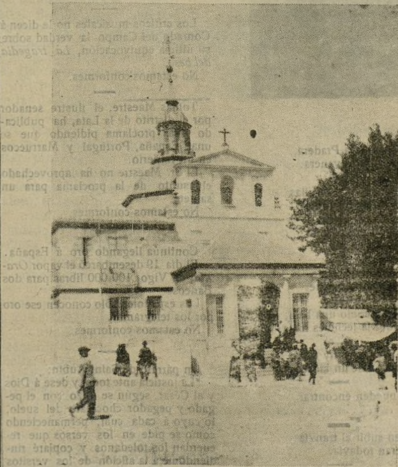
La romería del Santo.—La ermita de San Isidro.

Y tercera, por aquella frase memorable que habla de una capa que se perdió y que no parece, aunque todos los que la vieron pertenecían á la Tabla Redonda.