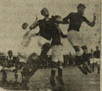
Dos jugadas. El equipo de Selección Norte.

Preparémonos á presenciar un partido muy competido, pues el Racing viene dispuesto á conseguir la victoria, y el Madrid , por su parte, también querrá salir vencedor. El partido tendrá lugar por la tarde.