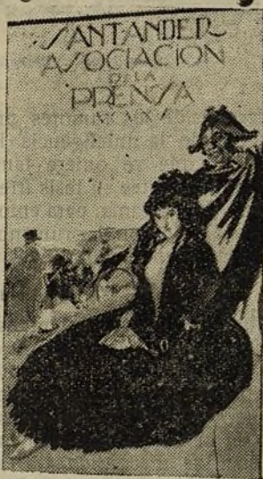
El cartel de Santander.

Que debió tomar á usura la cantidad necesaria, y no hacer mala figura con su pobre indumentaria.