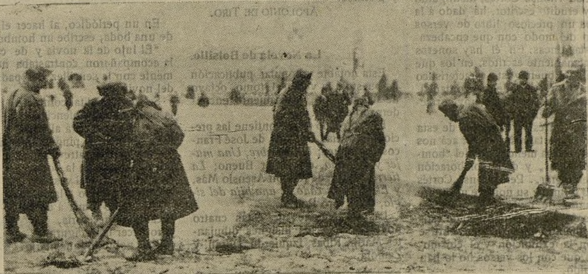
Servia en la guerra.—Prisioneros austriacos haciendo la limpieza de las calles de Nijmegen.

Escribimos este artículo cuando aún no se conoce lo acordado por el Parlamento italiano. Todos los hechos