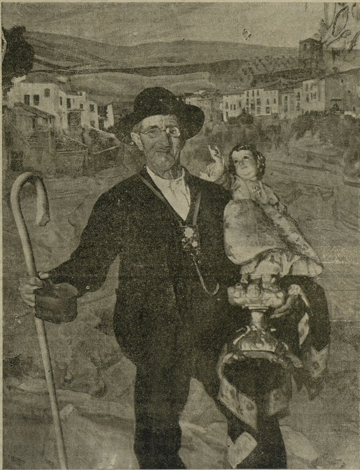
El San' y la limosna. — Cuadro de Rodríguez Acosat.