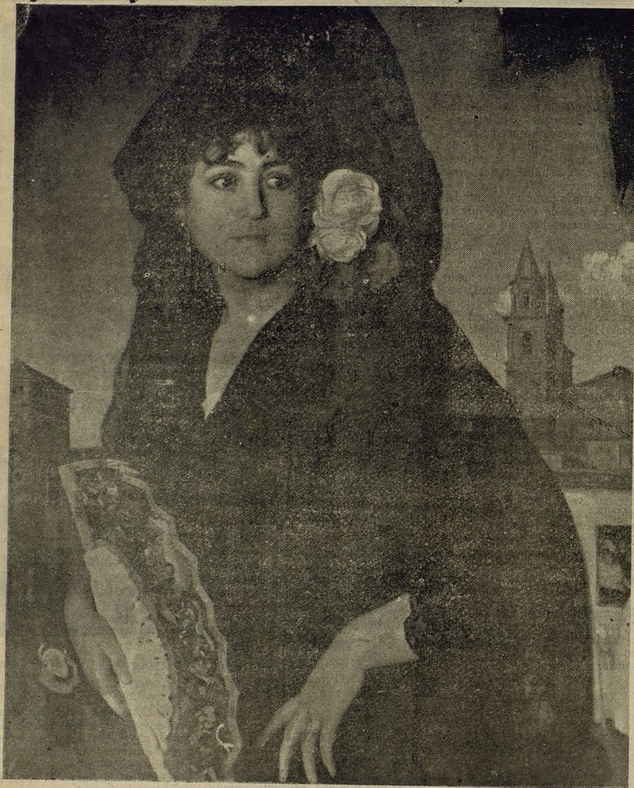
Abril.—Retrato pintado por Rodríguez Acosta.