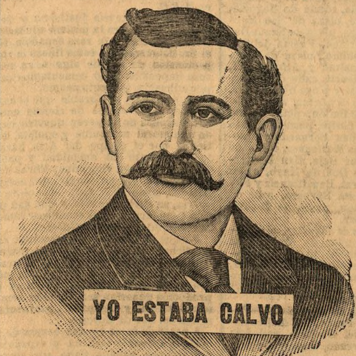
YO ESTABA CALVO

¿Está Ud. calvo, tiene el cabello en mal estado (duro o debilitado), o se le cae? Si es así, desee que llegue Ud. a conocer enteramente mi verdadero "Hair Grower", y tenga cuenta exacta de lo que puede dar de sí. El "HAIR GROWER" es la fuerza concentrada que fertiliza el cabello. Aplicado sobre el cuero cabelludo, penetra en los poros, reconstituye, en su estado normal, los folículos del cabello, y hace crecer de nuevo una cabellera abundante, sedosa y lustrada, admirada por todo el mundo y considerada como prueba evidente de belleza y fuerza física. No quiero que compare Ud. mi preparación si no debe darle resultado y opino que el ofrecimiento que hago de una caja de ensayo es obtener SU CONFIANZA DE Ud. Procuró siempre no exponer en mis anuncios pretensiones exageradas acerca de los efectos maravillosos de mi verdadero "Hair Grower", pues prefiero con mucho que ese elogio lo hagan las personas que lo han ensayado y, conseguido resultados satisfactorios con su empleo. No vendo mi verdadero "Hair Grower" únicamente porque CREO que hará crecer el pelo; por experiencia propia SE que si lo hará crecer. Hace algunos años encontréme yo enteramente calvo y a los cuarenta días de emplearlo, conseguí que el cabello volviese a crecer hermoso y espeso.