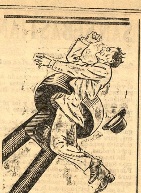
Atenaceado por el dolor, atormentado por el sufrimiento: tal es el modo como puede representarse al hombre que tiene mal estómago, al hombre que digiere mal. De todos los actos fisiológicos, el que más influye en el estado moral nuestro es la digestión: ésta nos pone tristes ó alegres, taciturnos ó locuaces, alegres ó melancólicos, confiantes ó desanimados, sin que nos enteremos de ello, sin que podamos evitarlo.

Maese Eudo pegó con el pie en el suelo, dando muestras de viva impaciencia. —¿Locos! ¡Miserables!—exclamó con arrebato.—No importa—añadió, después de un momento de silencio—; Reynold es realmente fuerte; es de temer. Sin embargo, ha cometido un error exponiéndose al azar. La casualidad le ha servido; pero ha hecho mal. Cuando interesa hacer desaparecer a un hombre no se ha de armar una mano ajena, y así se tiene seguridad del éxito. Pero esta juventud vana y orgullosa se cree con suficiente inteligencia. ¿Y si Reynold quisiera luchar ahora conmigo? ¿Y si mi obra se