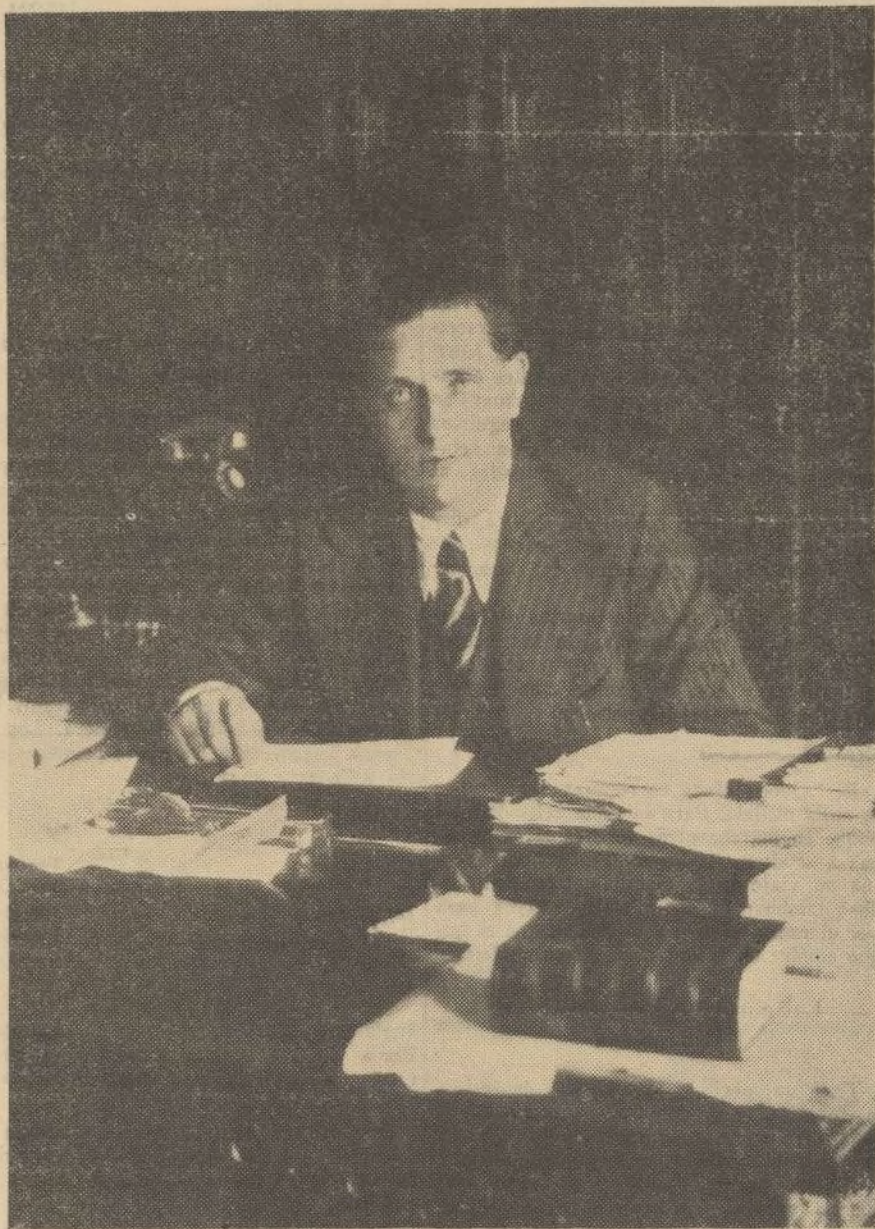
Ilmo. señor don José López Varela. Subsecretario de Trabajo.

Pardas, segundas.—Merina, 6; Entrefina superior, 5,50; Entrefina corriente, 4,50; Entrefina roya, 5; Entrefina inferior, 5,25; Merinas, garras, 5,25; Entrefinas idem, 3,75; Mercado animado con tendencia al alza.