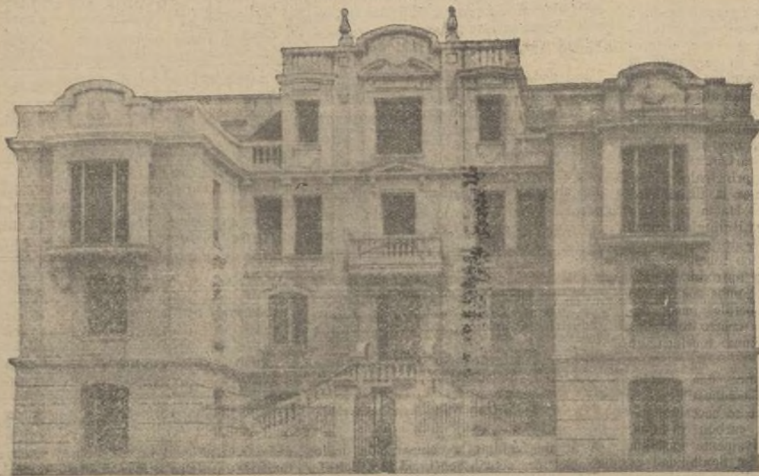
Edificio de "El Financiero" Ayuntamiento de Madrid

Invitamos a todos nuestros clientes y lectores para que figuren con anuncios e informaciones de sus respectivos negocios e industrias en las páginas de publicidad de este gran número extraordinario, que tendrá gran circulación y permanencia.