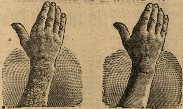
Antes de la curación. Después de 15 días de tratamiento

Curación radical de todas las enfermedades de la piel, de las heridas de las piernas y del artrismo, reumatismo, gota, dolores, etc., por medio del