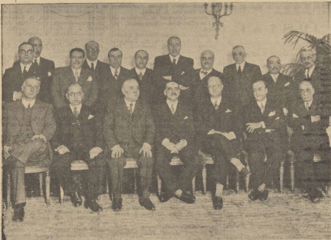
Banquete anual celebrado ayer por el Consejo de Administración y Consejo de Intervención del Banco de Crédito Local de España, con asistencia del ministro de la Gobernación, señor Salvador Carreras, después de la Junta general ordinaria de accionistas