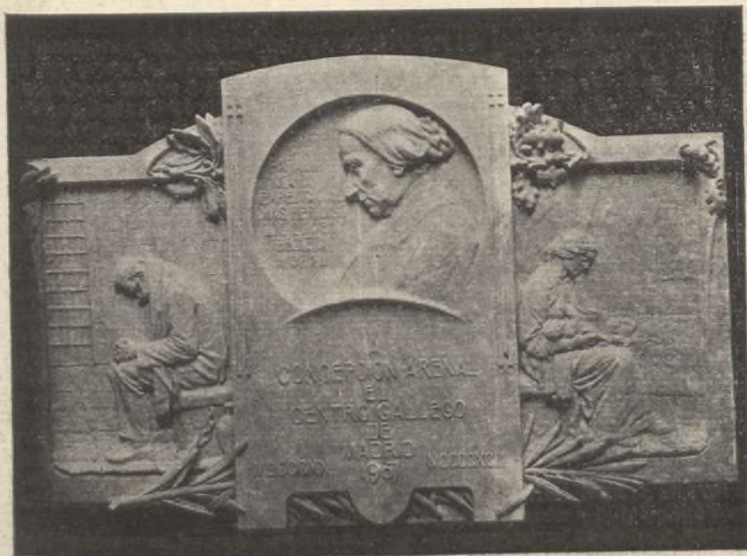
TRÍPTICO DE CONCEPCIÓN ARENAL