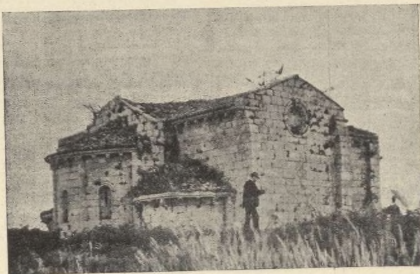
Capilla de San Miguel de Breamo.

visa son panoramas incomparables. A los inteligentes que han tenido el gusto de visitar aquel poético lugar les ha llamado la atención el maravilloso aspecto que ofrece. Quizá no haya pintor en el mundo, por muy renombrado que sea, capaz de hacer con su pincel é imaginar en su idea cuadro más grandioso que el que á los ojos se presenta: las elevadísimas montañas; los cristalinos y caudalosos ríos que las cruzan; las relumbrantes rías, en cuyas tranquilas