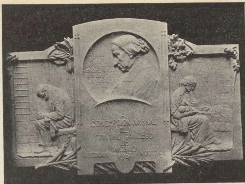
Triptico de Concepción Arenal.

Ahí se hallan algunas de las muchas con que nos sorprendió su estudio.