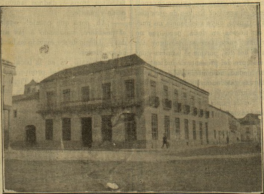
DAIMIEL.—FACHADA DEL «CASINO DE LA ARMONIA»

Cuando estas cuartillas vean luz los activos dueños de esta casa, para ensanchar su negocio y ampliar su local, se habrán trasladado de la calle de Emilio Nieto a la del Comercio, grandísimo local que están de-