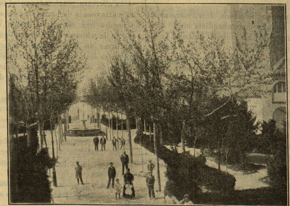
UNA VISTA INTERESANTE DE DAIMIEL