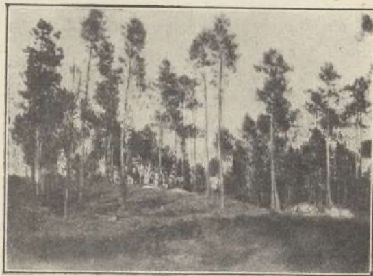
Alameda de los Remedios.

La Dirección general de Obras públicas ha dispuesto que de las 20.000 pesetas ingresadas en Septiembre último por la Diputación para caminos vecinales se destinen 12.000 á los del Pereiro á la Mezquita, distrito de Verín.