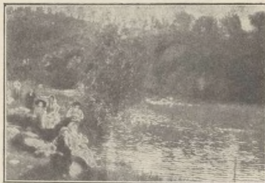
Orillas del Ulla.

Ya se sabe concretamente en El Ferrol qué dinero tiene este año la Fundación Amboage y