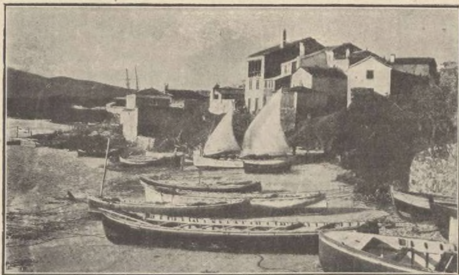
Ribera de la villa de Foz, provincia de Lugo.

Año III.—Núm. 22.—Madrid, 15 de Noviembre de 1908.—Colegiata, 20.