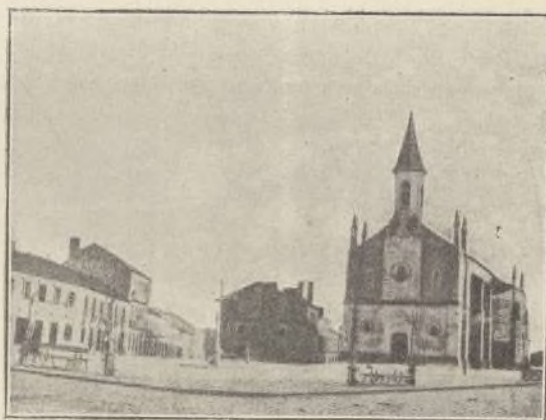
Plaza de Puenteareas.