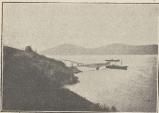
Cargadero de mineral en Vivero.