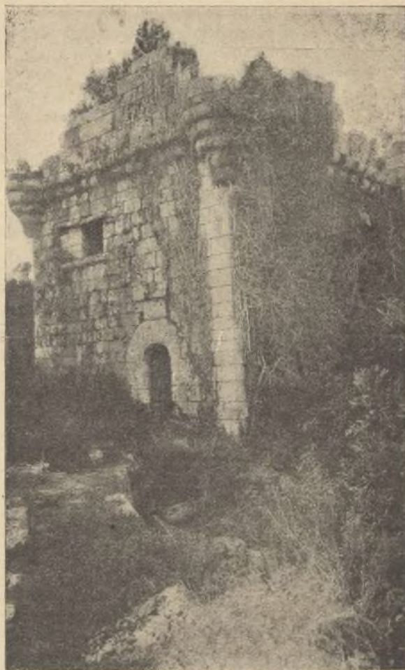
El castillo de Sobroso.

Cumplió el muchacho el encargo, y entonces la dama de áureo peine le llevó de la mano á unos palacios suntuosos, donde un descomunal gigante les salió al encuentro, dispuesto á tragarse