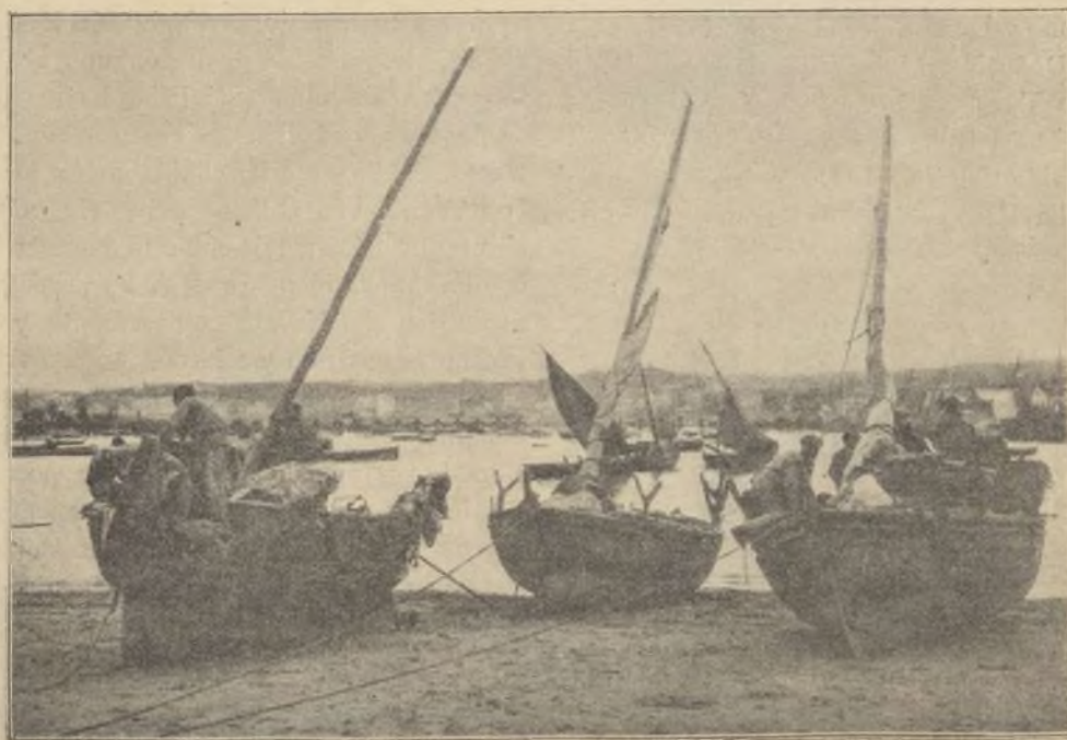
Bahía de la Coruña vista desde el Parrote.