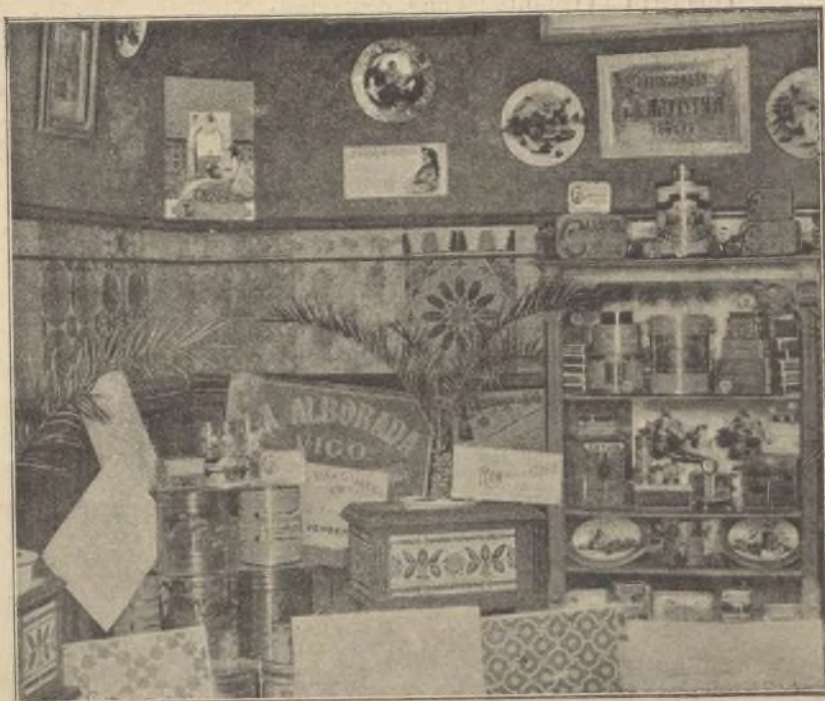
La Artística .—Salón-exposición de objetos.