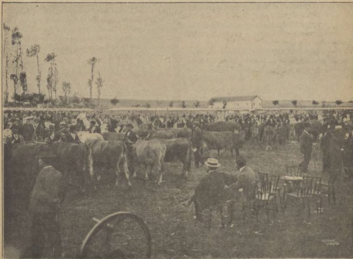
Vista del departamento de examen del ganado, en el momento de reconocer las vacas del país.

Tan útiles y necesarios certámenes, que actualmente son objeto de la protección del Estado, subvencionados, como eficaz medio de promover la mejora de la ganadería, son resultado de la cam-