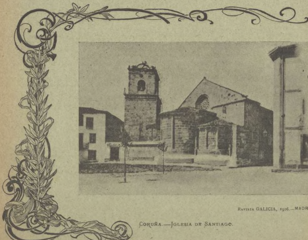
REVISTA GALICIA, 1906.—MADRID

Si se quiere saber la anchura que tiene el cauce de un río, fíjense los ojos en un árbol ú otro objeto prominente de la orilla opuesta, colocándose enfrente de él; y luego principiase á andar 10, 20, 50 ó más pasos, siguiendo la orilla del río; se fija aquí en el suelo una caña ó cosa parecida, y desde este punto se andan otros tantos pasos en la misma dirección del río. Finalmente, llegado á esta distancia, se dan las espaldas al río separándose perpendicularmente de él, hasta que se llega á ver que coinciden en una misma dirección la caña plantada y el árbol ó piedra que se escogió por señal de la otra parte del río. Cuéntense entonces los pasos que hay desde el sitio en que se halla uno, hasta el río, y esta distancia es precisamente igual á la anchura del mismo.