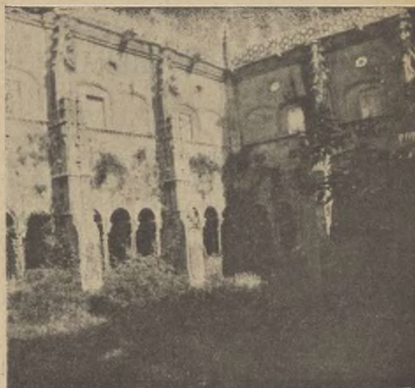
PATIO DE LOS OBISPOS.

Forman en su conjunto el edificio tres patios espléndidos: el llamado Patio principal , estilo renacimiento, y cuya construcción data de fines del siglo xvi; consta de tres cuerpos: el inferior, de arcos de medio punto sobre columnas de orden dórico; el segundo en platabanda y alfeizarado en los intercolumnios, y el superior ventanas con arco de medio punto, descansando sobre pilas-tras; se sube á uno y otro cuerpo por amplia escalera de piedra, cuya construcción no es de fecha anterior á la primera mitad del siglo xviii.