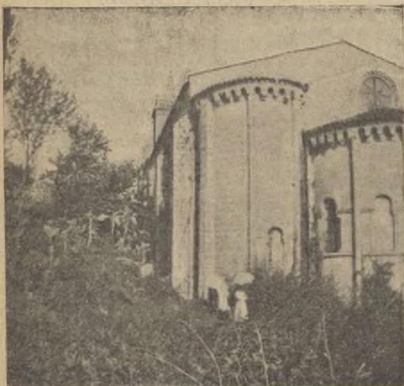
ÁBSIDE DE LA IGLESIA DEL EX MONASTERIO.

La iglesia, de estilo románico combinado con el ojival, tiene de notable el ábside, que es her-