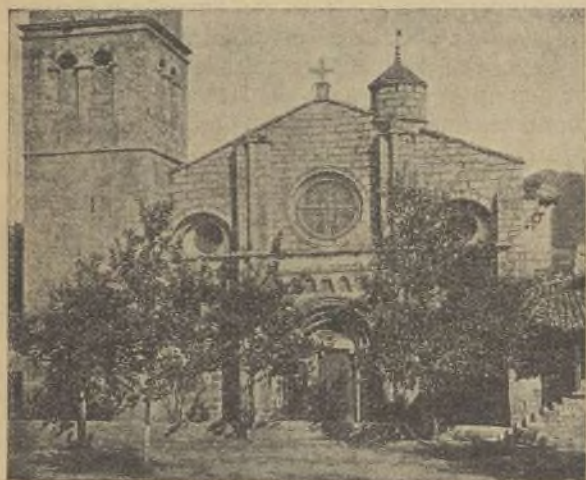
JUNQUERA DE AMBIA—LA COLEGIATA

En la montaña plácida, de resbaladizas pendientes, los sotos de apiñados castaños; detrás del