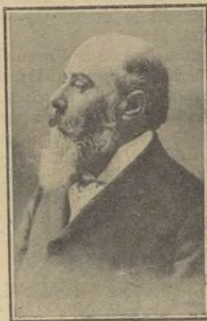
EXCMO. SR. D. JUAN FERNÁNDEZ LATORRE.

Estos rasgos demuestran, pues, de modo irrefutable, que la Coruña ha hecho justicia á sus mujeres y á sus hombres, y que es agradecida á sus bienhechores.