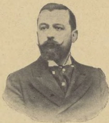
EXCMO. SR. D. GABINO BUGALLAL ARAUJO

EX-MINISTRO DE INSTRUCCIÓN PÚBLICA Y BELLAS ARTES