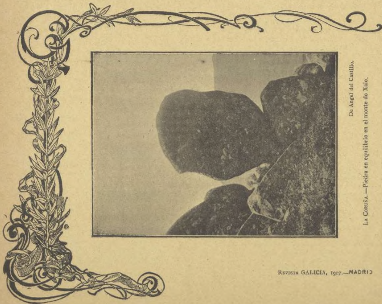
De Angel del Castillo. LA CORUÑA.—Piedra en equilibrio en el monte do Xalo.

Asómate á la ventana y me verás por la calle con una chaqueta nueva de una vieja, de mi padre.