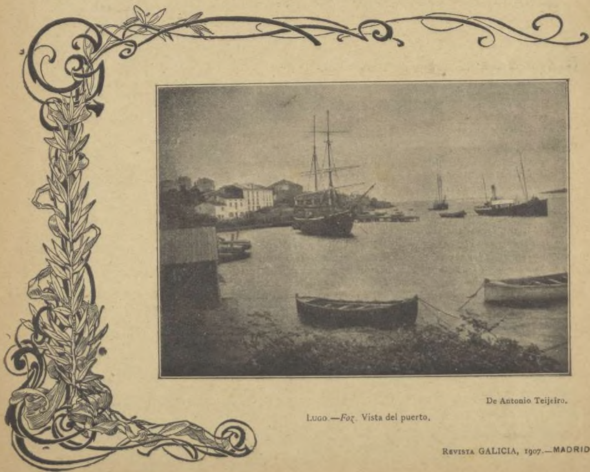
Lugo.—Foz. Vista del puerto.