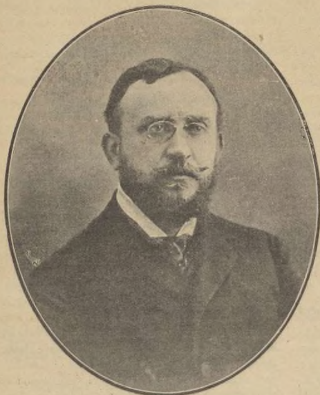
EXCMO. SR. MARQUÉS DE FIGUEROA Ministro de Gracia y Justicia.

Con el ceremonial de costumbre se celebró en esta Corte, el día 16 de Septiembre anterior, en el Palacio de Justicia, el acto solemne de la apertura de los Tribunales.