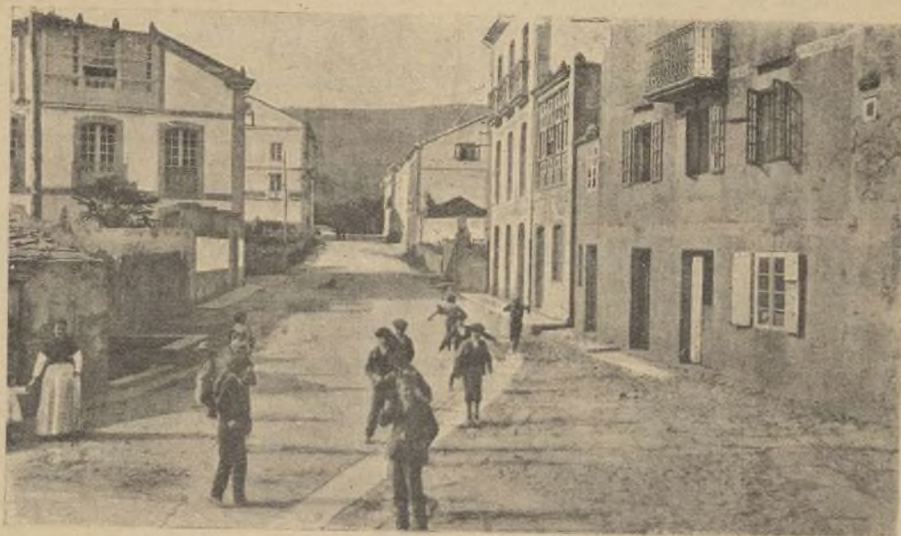
CALLE PRINCIPAL DE FERREIRA DEL VALLE DE ORO.

Para formarse idea de la edificación de Ferreira, publicamos el fotograbado representativo de la calle de «Pardo de Cela» situada en la parte de la carretera que se dirige á Vivero.