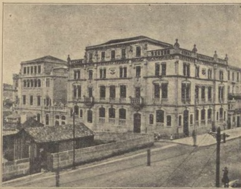
ESCUELA DE ARTES E INDUSTRIAS