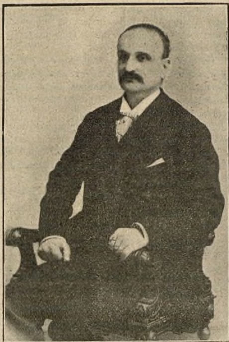
En Carlos Rojo y Botella