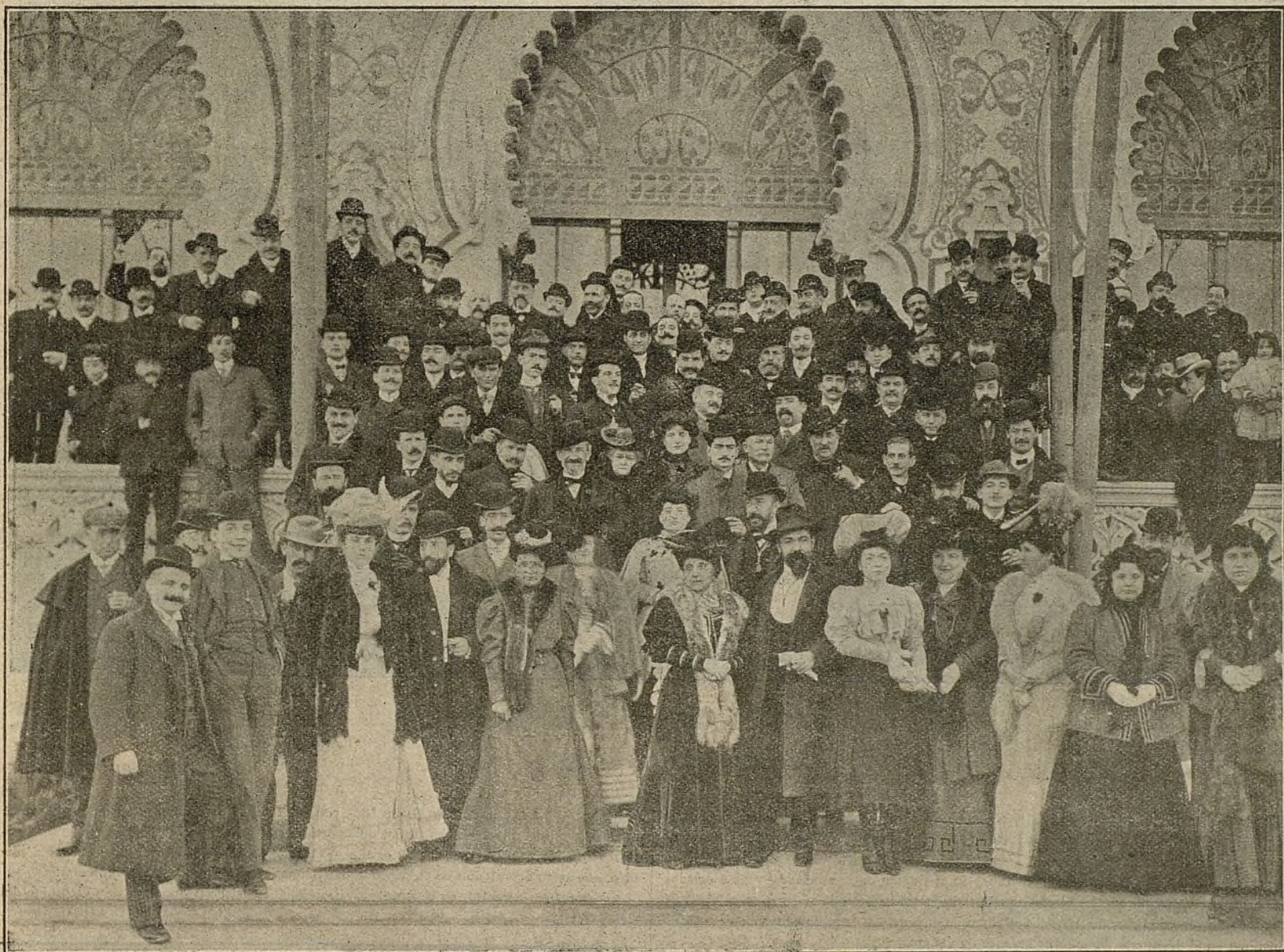
L' AMICH DEL POBLE CATALA.—Sortida dels Assambleístas del Hotel Tibidabo dirigintse al Funicular.

Durante el año 1905 se han recaudado por el concepto de gastos de administración pesetas 10659, con cuya suma, que dá una cantidad mensual de 888 pesetas 25 céntimos, se ha atendido á los sueldos del personal fijo de los departamentos de Presidencia, Secretaría, Contaduría y Tesorería y servicio de periódico y á la remuneración de los jefes de dichos departamentos por sus trabajos personales, habiéndose llevado con el mayor orden y rapidez la complicada obra de todos los dichos departamentos debiendo hacer constar que á pesar de la