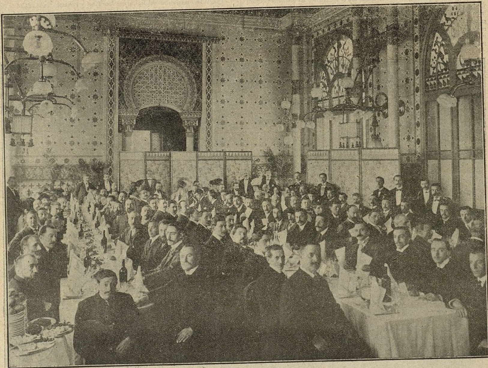
L' AMICH DEL POBLE CATALA.—Dinar servit al Hotel Tibidabo en obsequi dels Assambleístas de 1 a any 1906

Sentado este hecho y marcado el camino a seguir, «L' Amich del Poble Catalá» tocó los resultados de aquella virtualidad de sus principios, viendo aumentar sus filas con nuevos adeptos que se convertían en otros tantos esforzados campeones del mutualismo que hacían llegar por todos los lugares de nuestra tierra las ideas de mejoramiento económico y social