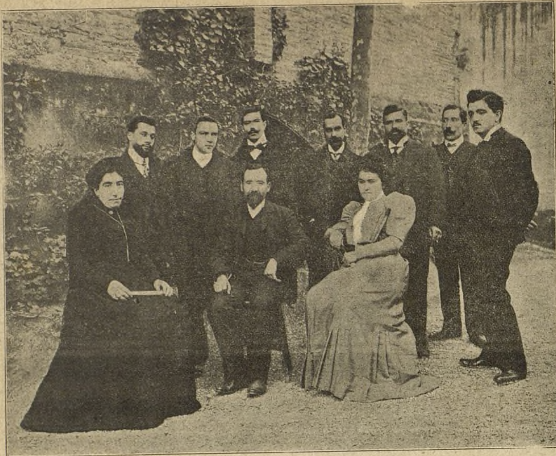
El Concell d' Administració de la secció 14 (Poblet-Barcelona)