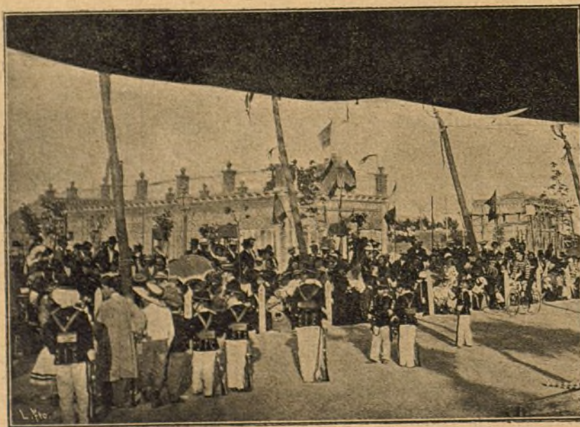
Aspecto de la fiesta, momentos antes del reparto de premios á los alumnos del Batallón escolar.

la materia beneficiamos sus frutos naturales, las acciones morales y la inteligencia; alcanzando así el mayor grado de cultura humana: hagamos del niño