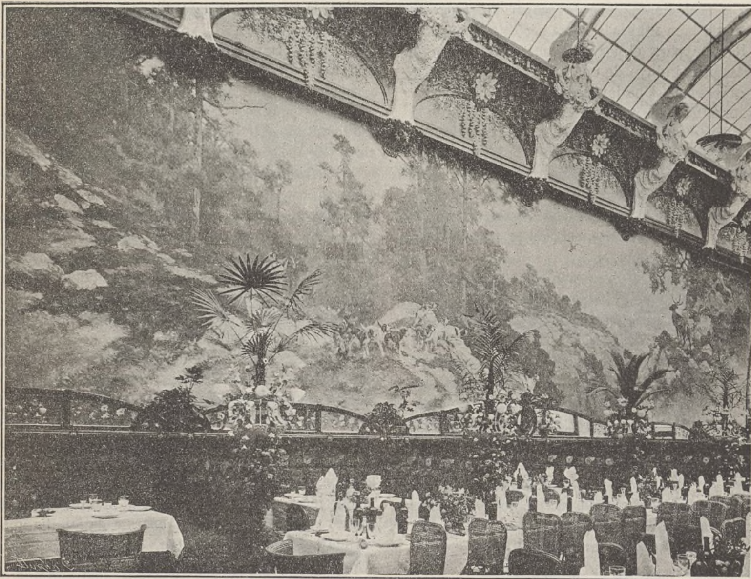
DETALLE DE LOS DEPARTAMENTOS-COMEDORES DE UNO DE LOS LADOS DONDE ESTÁ EL LIENZO PINTADO POR EL SEÑOR REGIDOR