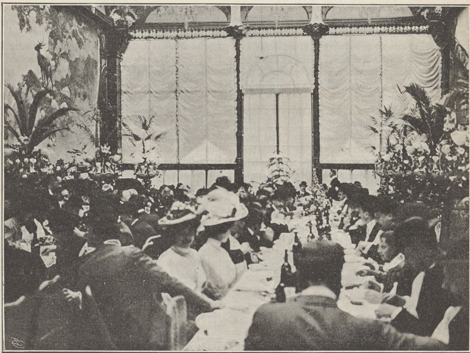
BANQUETE DE INAUGURACIÓN DEL SALÓN-RESTAURANT

Pero preciso es brindar. Y ¿por quién lo haré? ¿Por los éxitos crecientes de la Ciudad Lineal, por los triunfos de la Compañía Madrileña de Urbanización? No, porque visibles están sus obras y las obras hablan con más elocuencia, que lo haría mi torpe labio.