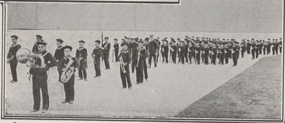
EN EL FRONTÓN. -- EL BATALLÓN DEL ASILO DE SANTA CRISTINA FORMADO ANTES DE DAR PRINCIPIO EL FESTIVAL INFANTIL: : : : :