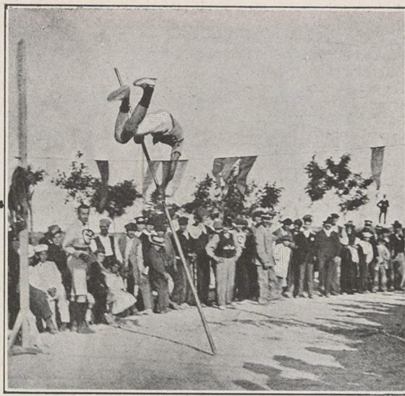
CAMPEONATO DE SALTOS.—SALTO de 2,25 METROS DE ALTURA, CON GARROCHA