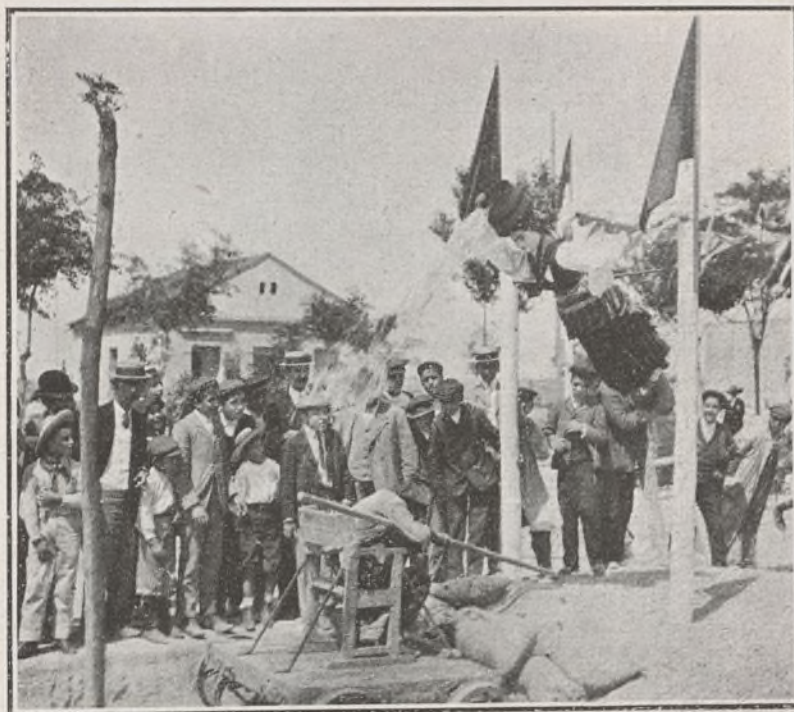
CUCAÑA CÓMICO-ACUÁTICA, INAUGURADA EL DÍA 14 DE JUNIO

Después de ejercer la caridad, ejercitar los derechos ante los tribunales pacífica y sosegadamente, si ha lugar á ello, y después estudiar en la escuela y en casa, el modo mejor de evitar desgracias, lo cual no es obra de una pobre empresa, si no de la sociedad en general.