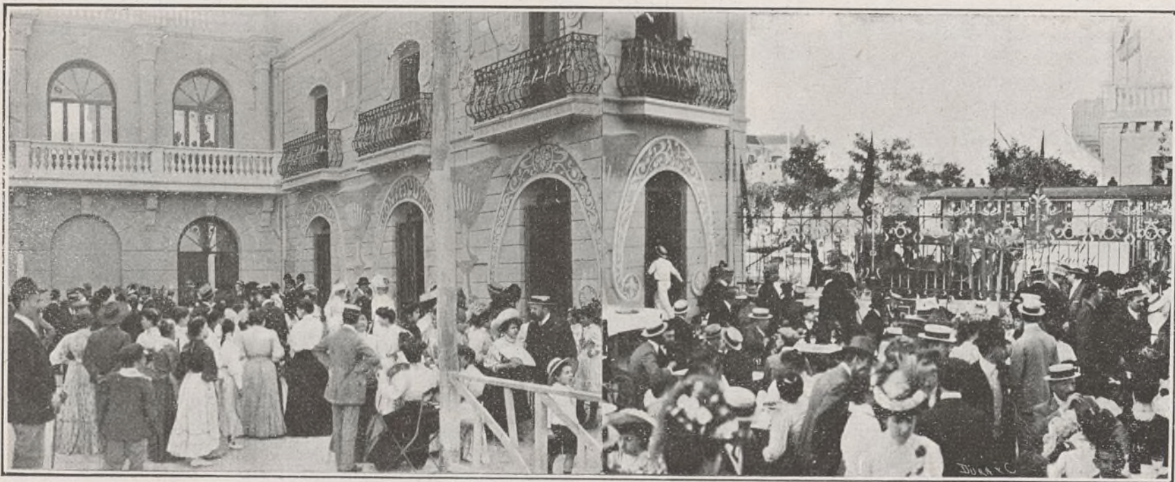
ASPECTO DEL RECINTO DEL TEATRO, FRONTÓN, BAR Y DIVERSIONES VARIAS, MOMENTOS ANTES DE EMPEZAR EL FESTIVAL INFANTIL EL DIA 14 DE JUNIO

Las pruebas definitivas para la proclamación de campeón, porque las niñas que concurren no practicaron la operación de dividir, no se pudieron hacer; pero el Jurado confía en que las prácticas de Aritmética por niños y niñas habrá de constituir en futuros tiempos el más importante de los concursos intelectuales en la Ciudad Lineal, cuando hayan desaparecido las pueriles preocupaciones de los tiempos presentes y pasados.