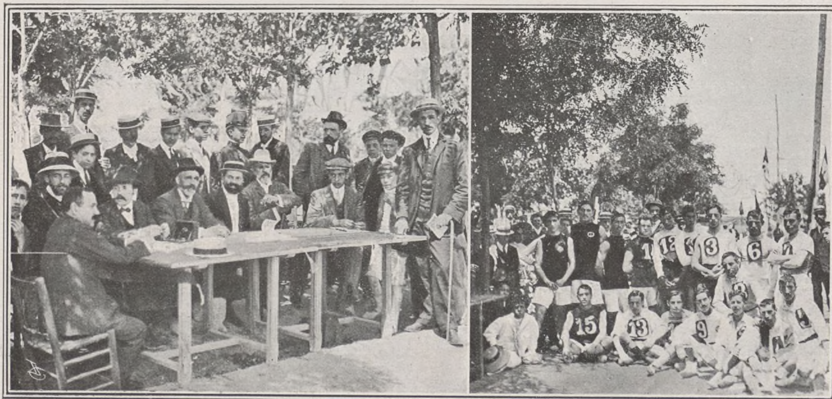
EL JURADO DE LAS CARRERAS Á PIE—LOS QUE TOMARON PARTE EN EL CAMPEONATO DE CARRERAS CON OBSTÁCULOS DE SALTO.