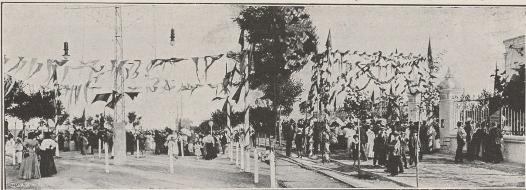
VISTA GENERAL DEL LUGAR DE LA FIESTA