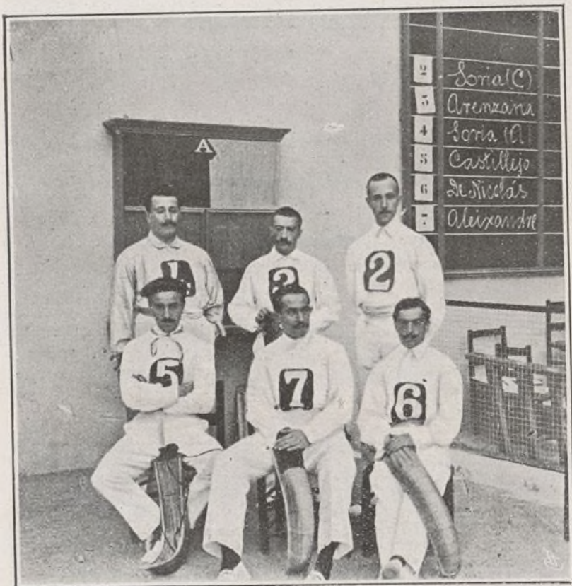
LOS QUE TOMARON PARTE EN EL CONCURSO DE JUEGO DE PELOTA

Nosotros somos obreros, tan dignos de consideración por lo menos como los que se amotinan neciamente contra nosotros como si los maquinistas y cobradores y empleados todos de la Compañía no tuviesen corazón para sufrir al ver á un hombre hecho pedazos debajo de un tren, ni padres, hijos y esposas que participen de su dolor.