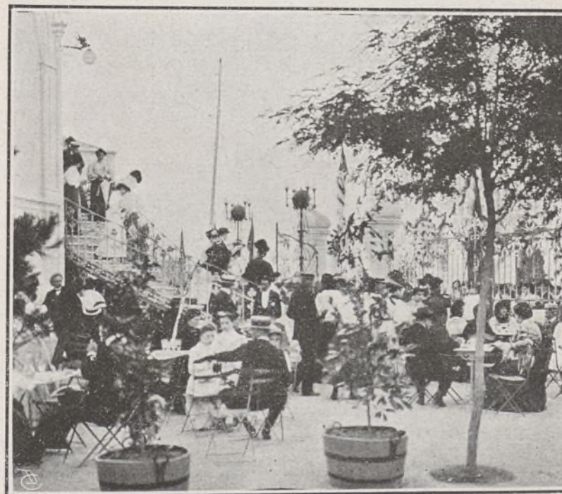
ASPECTO DE LA ENTRADA PRINCIPAL DEL TEATRO AL TERMINAR EL CONCURSO DE DECLAMACIÓN LA TARDE DEL 15 DE JUNIO.