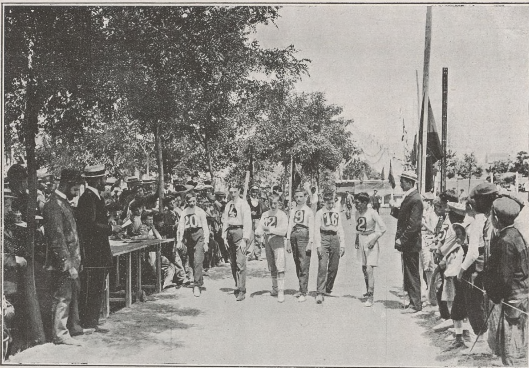
CAMPEONATO ESCOLAR DE CARRERAS Á PIE.—GRUPO DE CORREDORES ESPERANDO LA SEÑAL DE SALIDA