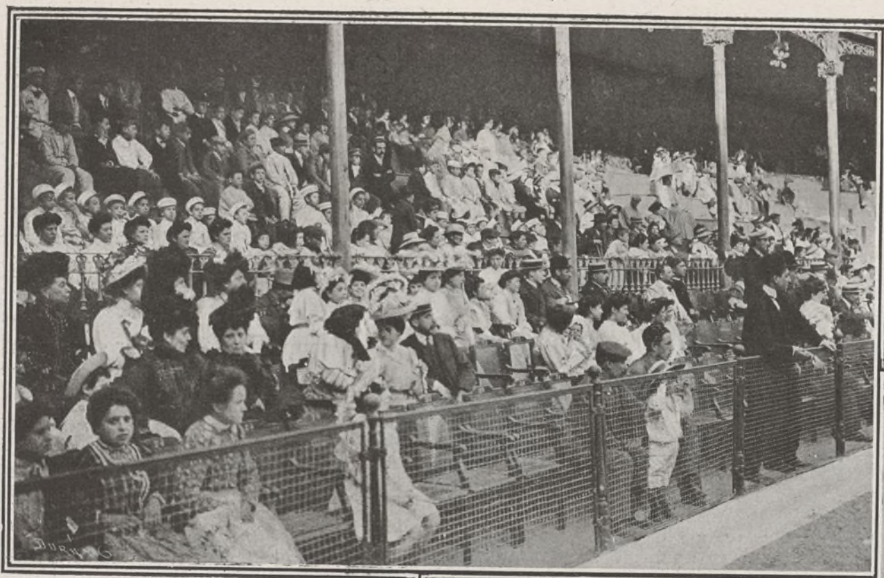
EL PÚBLICO PRESENCIANDO EL CONCURSO DE JUEGO DE PELOTA Á CESTA CELEBRADO LA TARDE DEL DÍA 14 DE JUNIO: : : : :