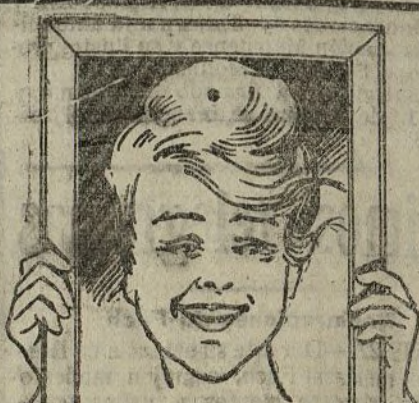
La imagen de la salud

Calle de Zurbano, núm. 21, bajo derecha, Madrid.