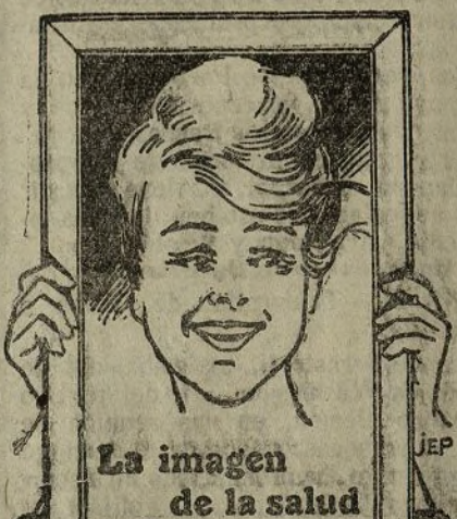
La imagen de la salud

Dirigir toda la correspondencia a ALTOS HORNOS DE VIZCAYA.-BILBAO