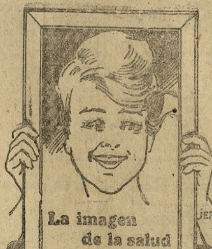
La imagen de la salud

Dirigir toda la correspondencia a ALTOS HORNOS DE VIZCAYA.—BILBAO