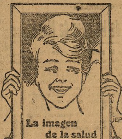
La imagen de la salud

Una tez rosa, la mirada viva y alegre, labios de carmín, un aliento fresco y agradable, el andar flexible, seguro. Fuerza, energía, buen humor. En una palabra: ¡vida! Esa es la dote de los dichosos que evolucionan con regularidad. Si quiere V. gozar de esa salud ideal, use V. tantas veces como fuere necesario, los