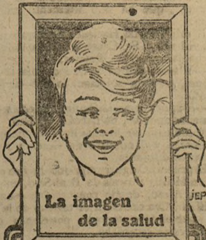
La imagen de la salud

Estos vapores admiten carga en las condiciones más favorables y pasajeros, a quienes la Compañía da alojamiento muy cómodo y trato esmerado, como ha acreditado en su dilatado servicio. Todos los vapores tienen Telegrafía sin hilos.