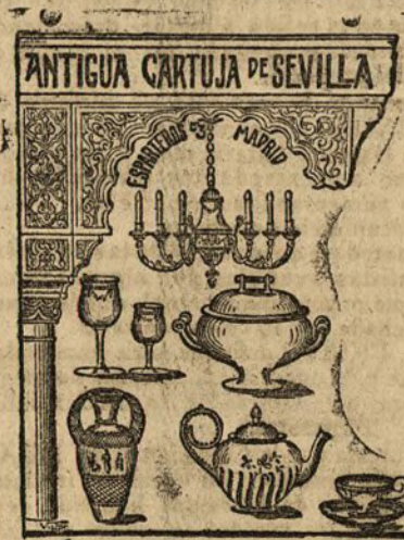
Antigua Cartuja de Sevilla Esparteros, 3.—Madrid

Estos vapores admiten carga en las condiciones más favorables y pasajeros, a quienes la Compañía da alojamiento muy cómodo y trato esmerado, como ha acreditado en su dilatado servicio. Todos los vapores tienen Telegrafía sin hilos.