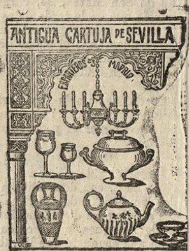
Antigua Cartuja de Sevilla Esparteros, 3.—Madrid

Dirigir toda la correspondencia a ALTOS HORNOS DE VIZCAYA, Bilbao