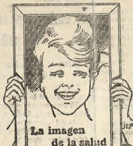
La imagen de la salud

Una tez rosa, la mirada viva y alegre, labios de carmín, un aliento fresco y agradable, el andar flexible, seguro. Fuerza, energía, buen humor. En una palabra: vida! Esa es la dote de los dichos que evolucionan con regularidad. Si quiere V. gozar de esa salud ideal, use V. tantas veces como fuere necesario, los