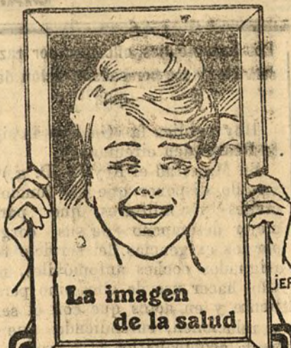
La imagen de la salud

Una tez rosa, la mirada viva y alegre, labios de carmín, un aliento fresco y agradable, el andar flexible, seguro. Fuerza, energía, buen humor. En una palabra: vida! Esa es la dote de los dichosos que evitan con regularidad. Si quiere V. gozar de esa salud ideal, use V. tantas veces como fuere necesario, los