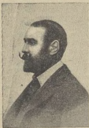
Don Manuel Allendesalazar, nuevo Alcalde de Madrid.

Nuestra Sociedad, siempre agradecida a todas aquellas personas que han favorecido, desde los comienzos, el proyecto de la «Ciudad Lineal», siente en estos momentos inmensa satisfacción por haber recaído el nombramiento de Alcalde de Madrid en don Manuel Allendesalazar, uno de los accionistas más entusiastas.