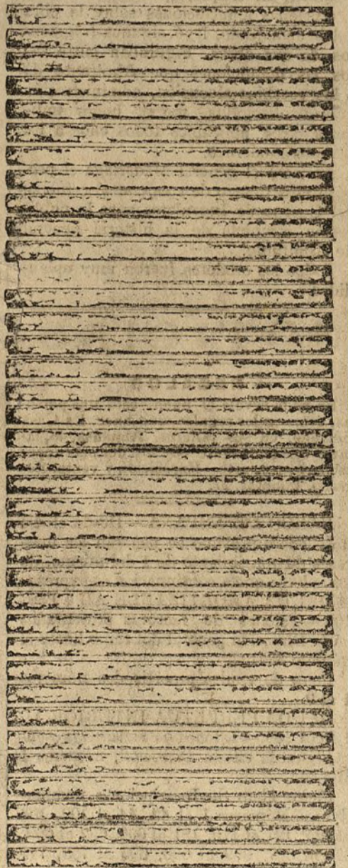
El yerro de la conversación a tres

La realidad decía que todos nuestros trabajos en pro de la conquista de Tánger se limitaban a esas entusiastas propagandas pro Tánger español, de los políticos y africanistas, civiles o militares, mientras que Francia se adueñaba lenta, pero continuamente, de la propiedad inter y extramarroquí de Tánger, multiplicaba sus entidades industriales y mercantiles, sujetaba con los lazos del interés al indígena, y con los de la obligación política a las autoridades representantes del Sultán, y en el terreno real ganaba mucho más de prisa sus puntos fuertes que nosotros en el terreno de lo utópico, de los discursos o los artículos periodísticos.