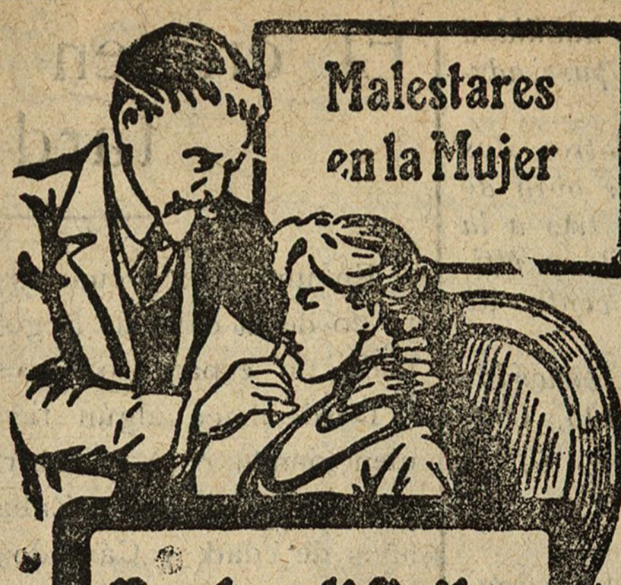
Malestares en la Mujer