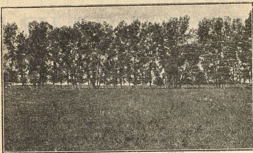
Cortina de arbolado de álamos de cinco años

En los Estados del Norte de la Unión, se usan varias especies de pino para cortinas de arbolado, mientras que en California, en donde se usan mucho las cortinas de arbolado para proteger los ranchos de fruta del calor de los vientos secos, que algunas veces soplan de las montañas, y de los vientos del mar del Pacífico, se ha visto que es muy conveniente el eucalipto.