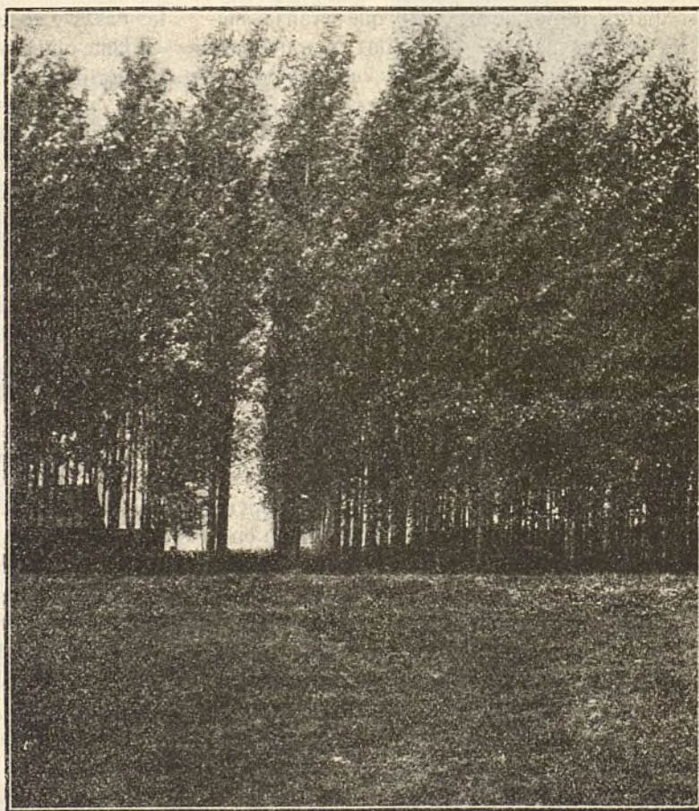
Magnífica cortina de arbolado formada de álamos de diez años

guido buenos resultados haciendo terraplenes y plantando arbustos encima de ellos.