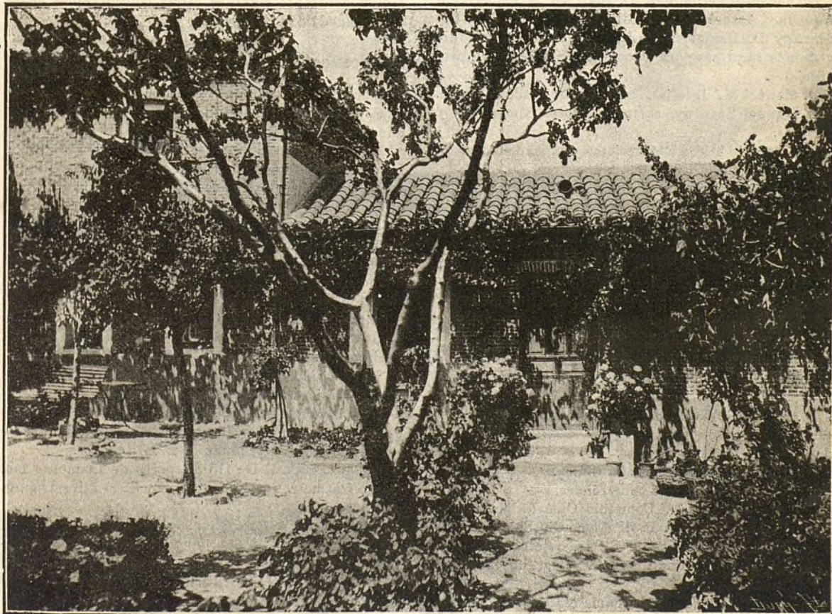
CIUDAD LINEAL.—Casa de obrero situada en la manzana 96

Sociedad Obrera Vecinal de Vicálvaro, programas y billeteaje.