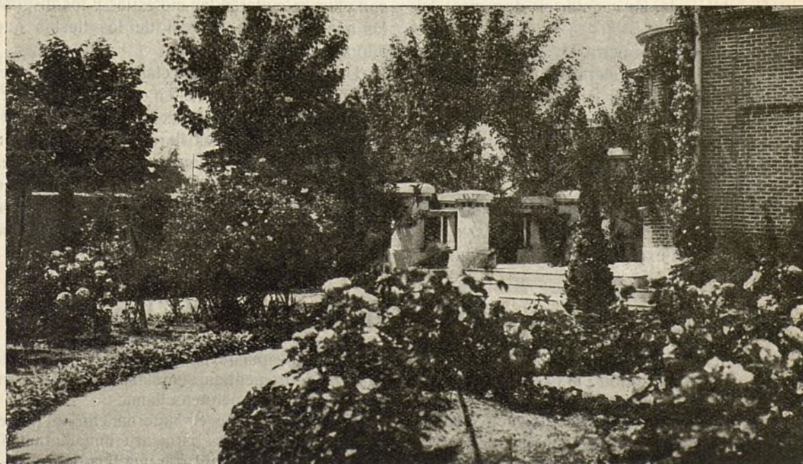
Jardín de una finca de la manzana 91 de la Ciudad Lineal. En el fondo, á la derecha del fotografado, se ve un precioso ejemplar de rosal trepador adornando la fachada principal del hotel

Las glicíneas variadas, clematítis, rosales mul-