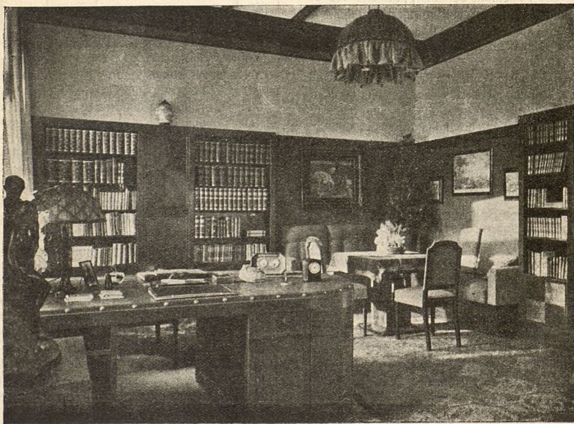
Una biblioteca-despacho, en la que se puede ver que los libros colocados por tamaños presentan mejor aspecto

En caso de utilizarse la biblioteca como despacho, serán más artísticas y lujosas las estanterías y la mesa central ó principal será lo más amplia posible.