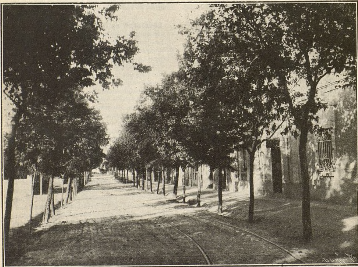
Una calle transversal de la Ciudad Lineal

De D. Silverio Bengochea, 6 conos para agujas y 6 válvulas de inyector, 6 conos con válvula para inyec-