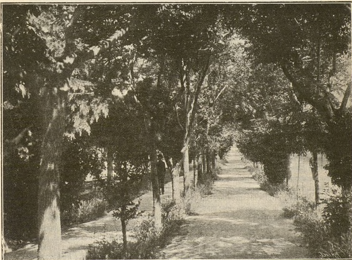
Uno de los paseos laterales de la calle principal de la Ciudad Lineal madrileña

en realidad lo es, si hubiera contado con el favorable movimiento de opinión que ha contado en Inglaterra la Ciudad-Jardín, si hubiera hallado Bancos y Departamentos ministeriales que como los ingleses facilitaran capitales en préstamo al 3 por 100 para esta nueva clase de obras públicas, la Ciudad Lineal madrileña se hubiera hecho en brevísimo plazo, y sin ningún contratiempo, en toda la extensión de 50 kilómetros que comprende su trazado y en lugar de una sola Com-