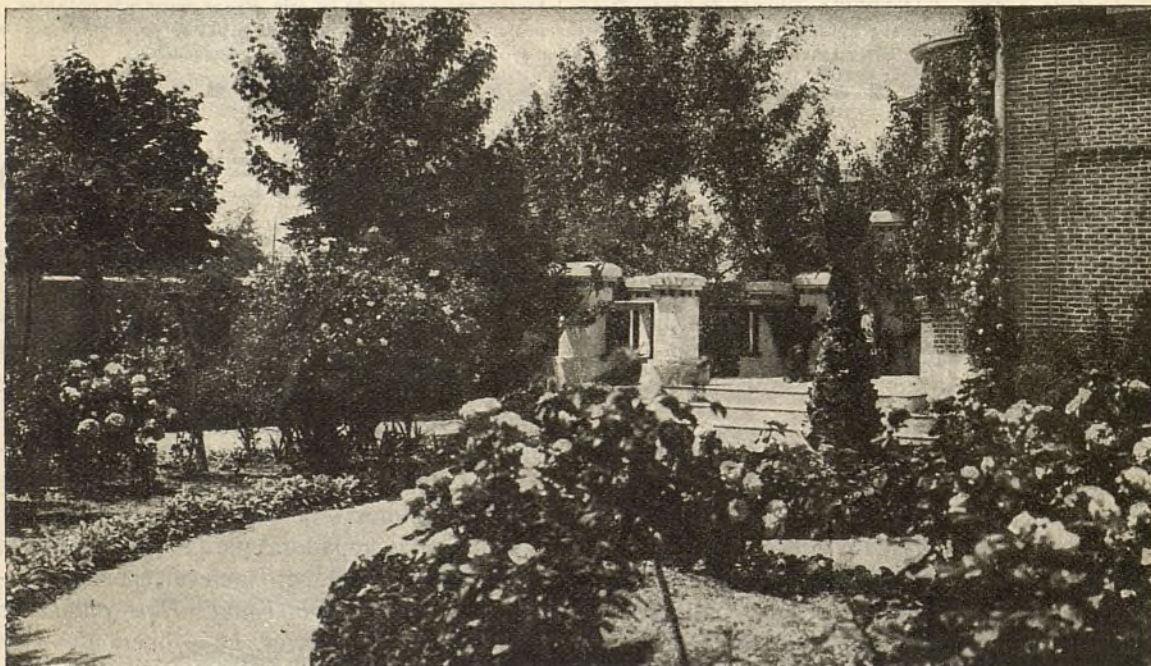
Un jardín de una finca de la Ciudad Lineal con hermosa plantación de rosales.

Como mejor árbol de sombra debe darse preferencia á la acacia blanca, cuya flor es de perfume suave y delicioso. Los eucaliptos también