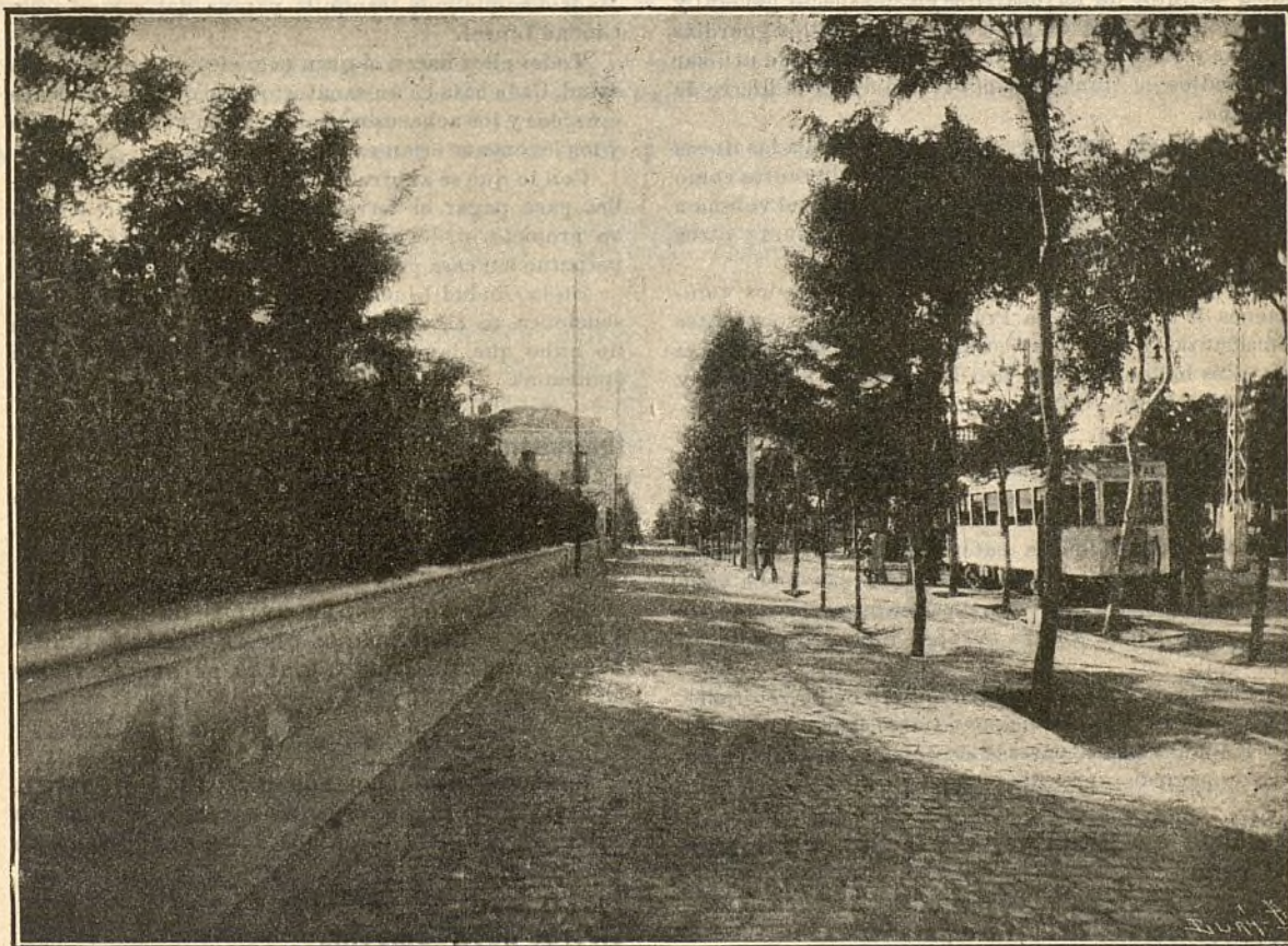
CIUDAD LINEAL.—Camino carretero a uno de los lados de la calle principal en el punto donde está situado el Parque de diversiones, cuya verja de cerramiento se ve á la izquierda del grabado

Al ocuparse de la vacuna, como medio eficazísimo de evitar la viruela, el Dr. Chicote se lamenta con mucha razón de que en España, siendo el primer país que declaró obligatoria la vacunación (año 1800), cause todavía tantas víctimas esa terrible enfermedad, debido al abandono en que se tiene la observancia de lo legislado, por lo cual, aun cuando algo se va modificando en esto nuestra manera de ser, la higiene no será aquí, como en otras naciones, la ciencia de la solidaridad, ni el mal desaparecerá, mientras haya ciuda-