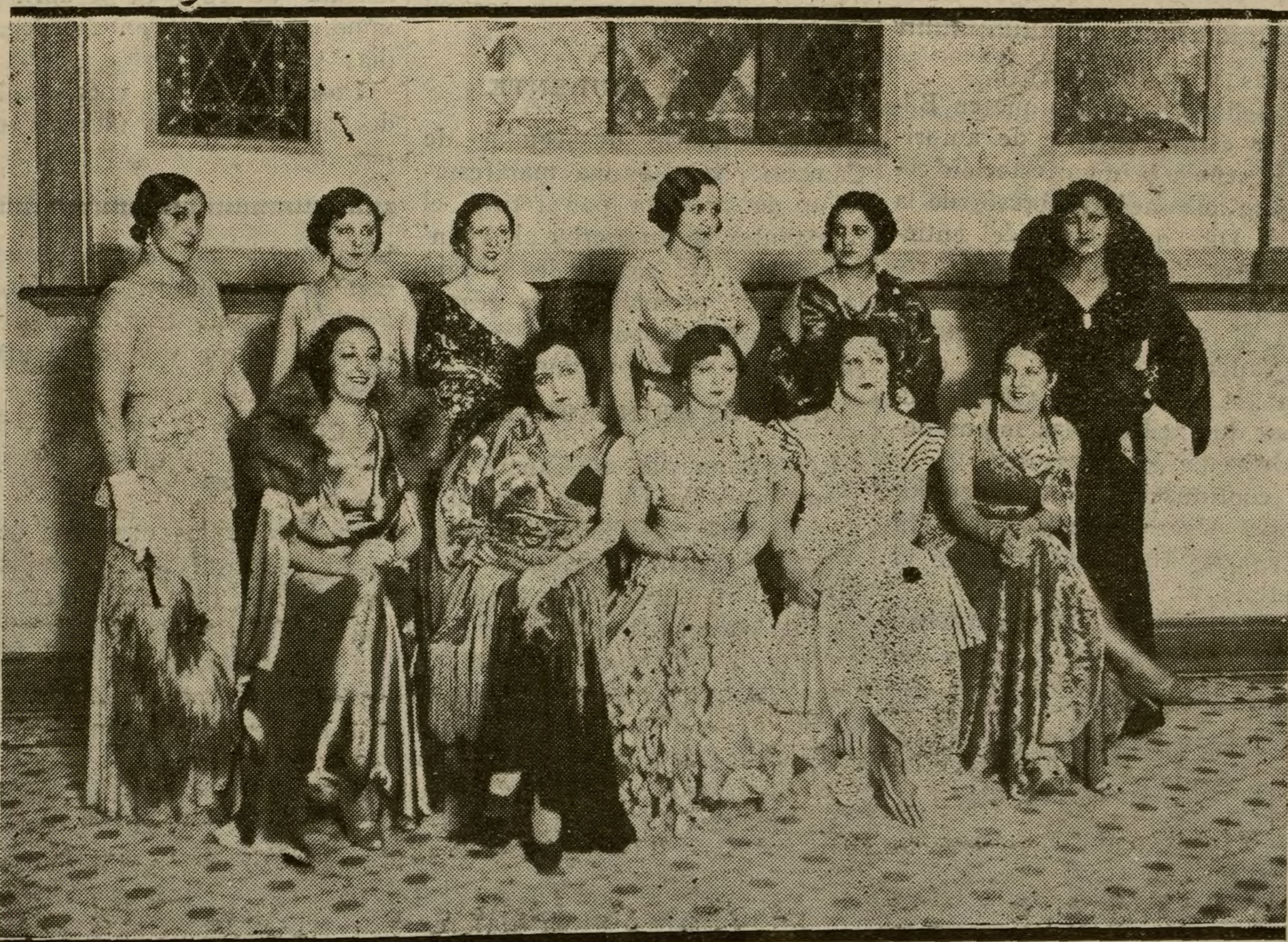
Las "misses" regionales aguardando el fallo del jurado.

EN SEPTIMA PLANA: SECCION FINANCIERA Y CUENTO