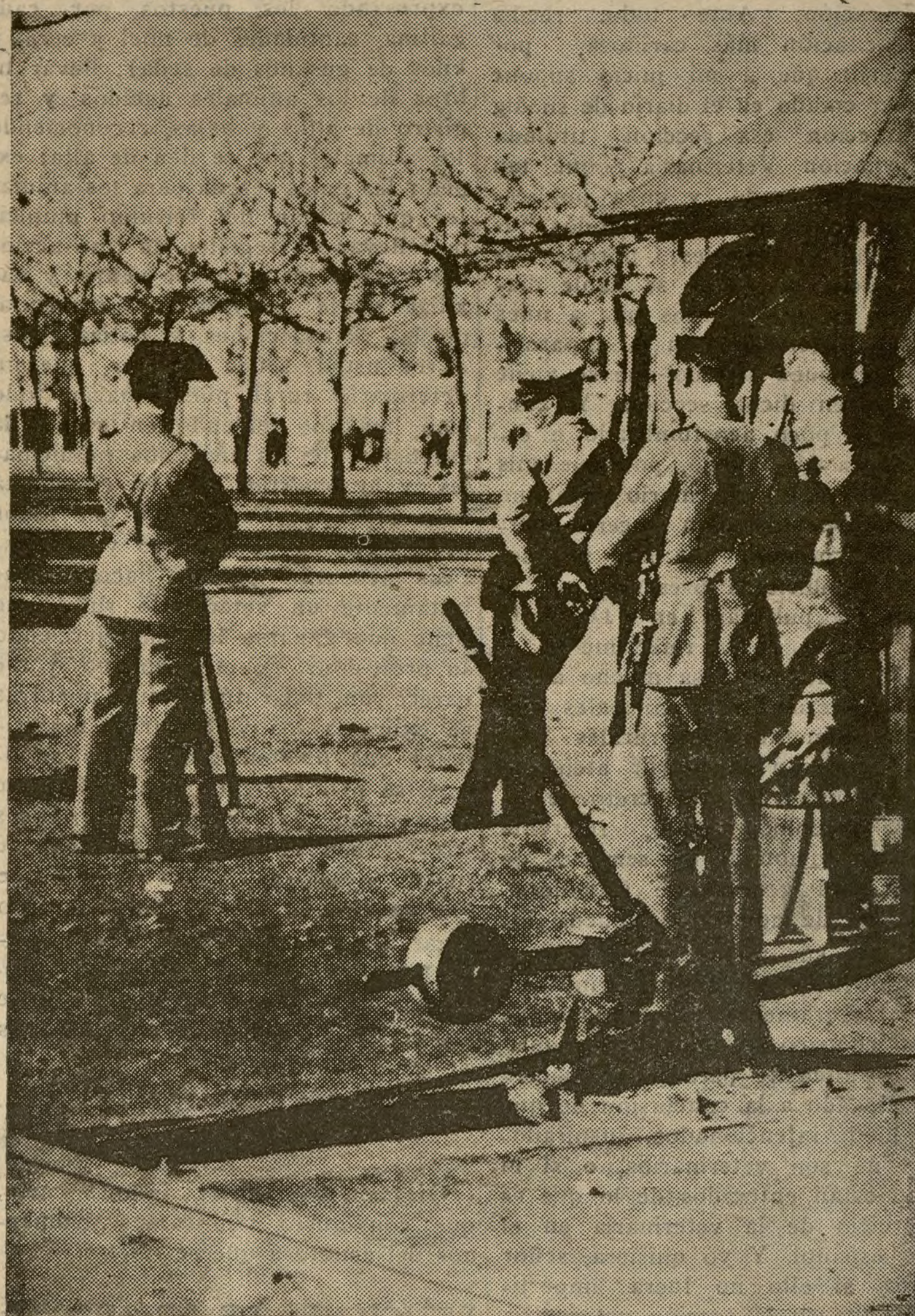
Guardias custodiando una aguja en una zona de huelga.