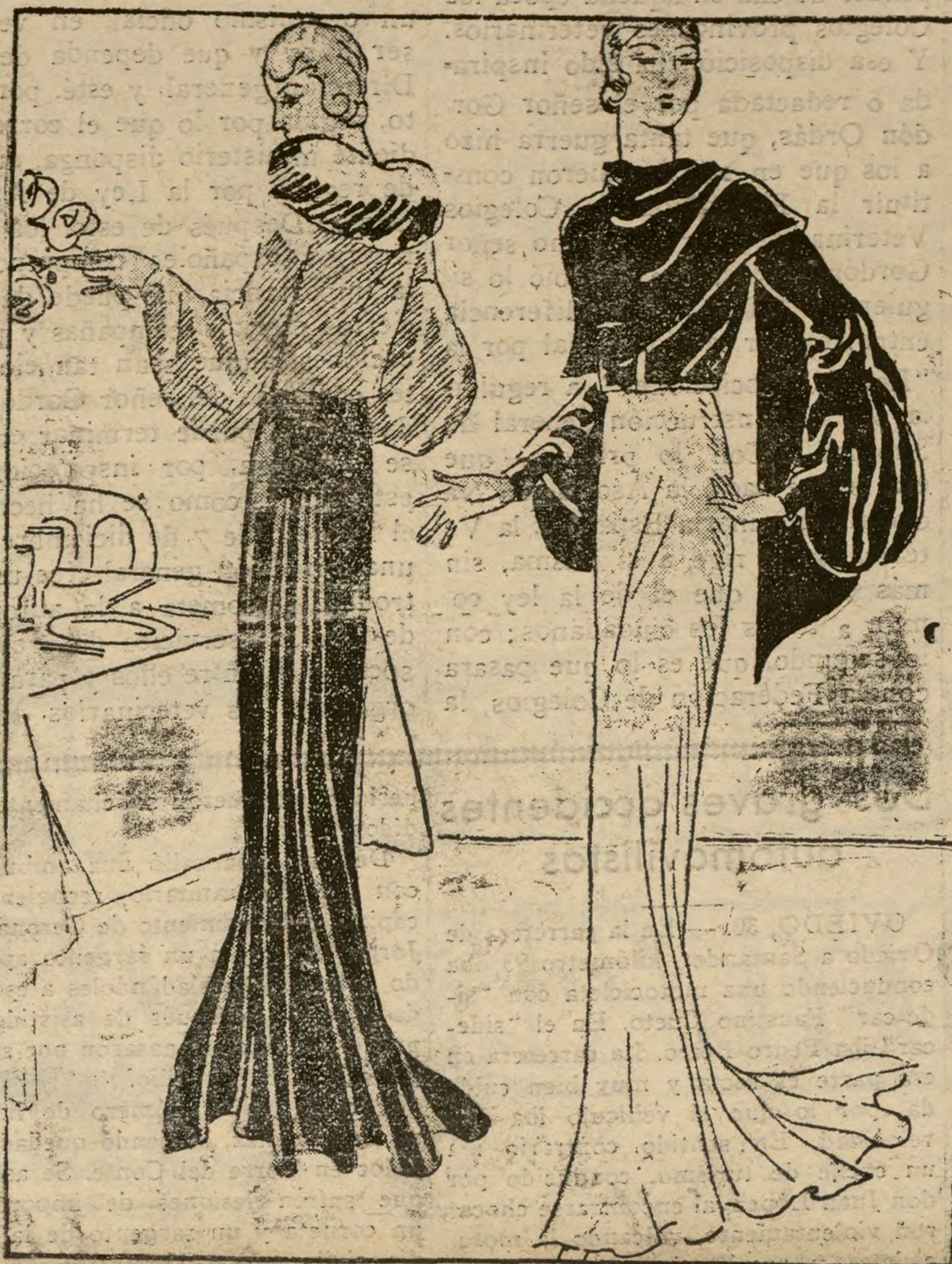
LOS ULTIMOS MODELOS