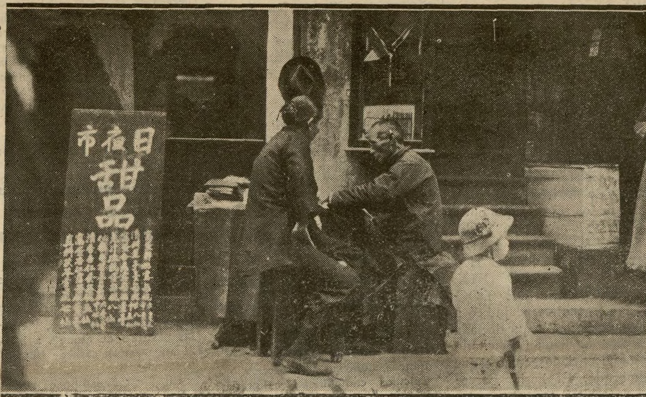
SHANGHAI.—TIPOS DEL BARRIO CHAPEI RECIENTEMENTE BOMBARDEADO POR LOS JAPONESES

EN SEPTIMA PLANA: EL OBRERISMO EN ACCION Y LA INFORMACION FINANCIERA